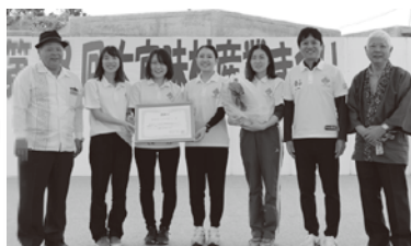
名桜大学ヘルスサポートへ感謝状