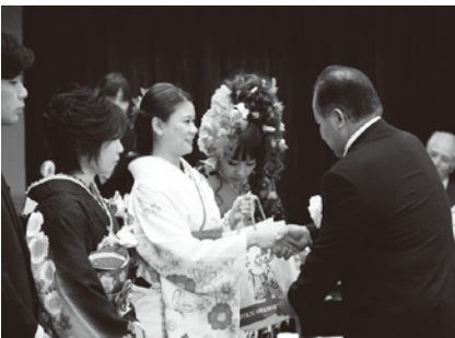
村長から記念品を贈呈される新成人