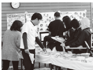
食育サットでバランスの良い食事を考える