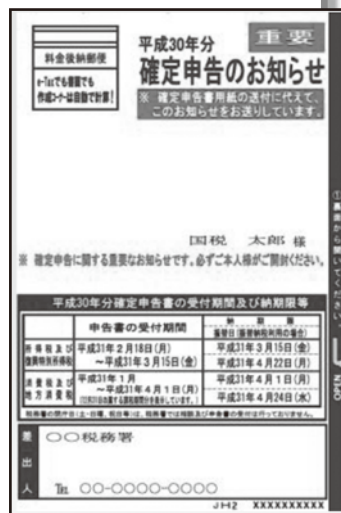
「確定申告のお知らせ」はがきイメージ

※ 所得税又は消費税の申告を、ご自宅等からe-Taxにより送信された方（各申告会場や指導会場においてご本人の電子証明書のみを付してe-Taxにより送信された方を含む。）や、税理士に依頼して作成・提出をされた方は、お知らせはがきが送付されません。 e-Taxをご利用の場合は、e-Taxにログイン後、メッセージボックスにて「申告のお知らせ」をご参照ください。