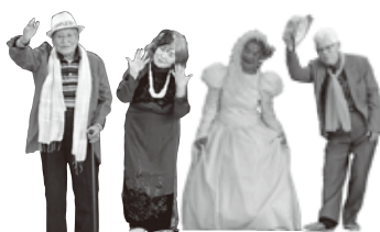
ファッションショー