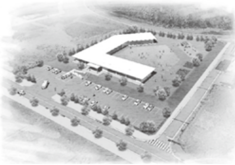
結の浜地区イメージパース

10月3日(火)、大宜味村農村環境改善センターにおいて、大宜味村幼保連携型総合施設整備に係わる住民説明会が行われ、84名の方々が参加しました。