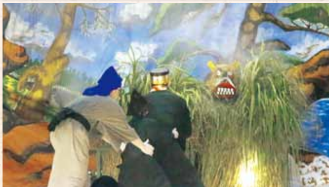
津波区豊年祭「大主」