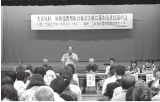
住民説明会の様子