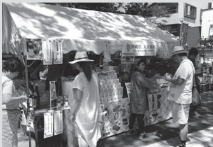
大宜味村のブース