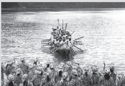
シナバ(青年浜)でハーリーを迎える女性たち