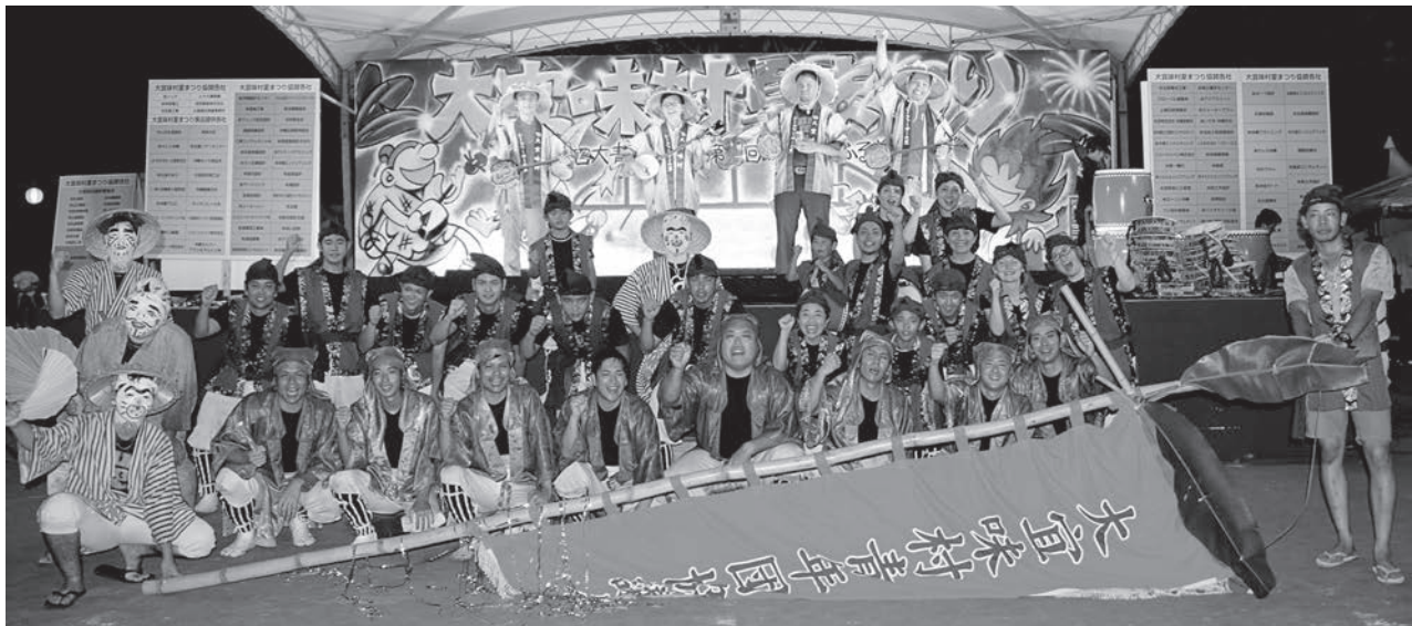
夏まつりを支える村青年団協議会