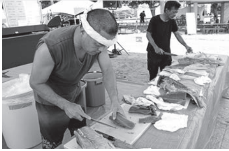
マグロ解体ショー