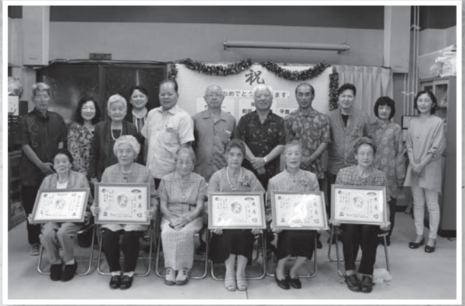
喜如嘉 トーカチ・カジマヤー