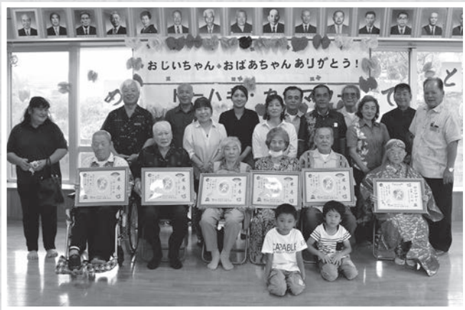
津波 トーカチ・カジマヤー