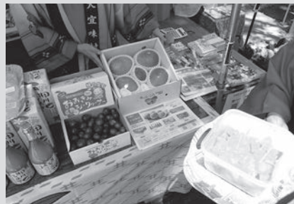
並べられた大宜味村の特産品

8月17日(土)、神奈川県逗子市の亀岡八幡宮において「第6回豆子沖縄まつり」が開催されました。