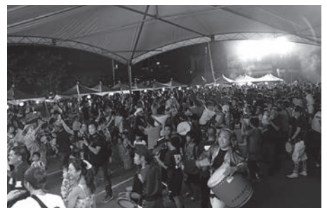
最後は皆でカチャーシー