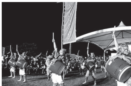
村青年団協議会によるエイサー