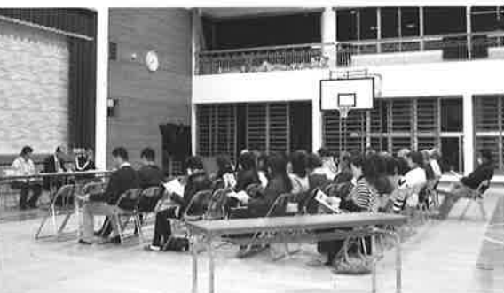
各校区で住民説明会を開きました。

主な変更点は下記の2つ。①幼稚園については、幼保連携型認定子ども園を新設、②中学校について、校舎・施設の基本設計から実施設計など工事手続きや実施などの期間を考慮した結果、2年間で期間は不十分のため、移設時期を平成27年4月から平成28年4月に変更。