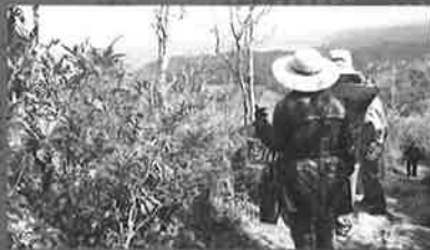
散策道からの景色を望む来場者ら