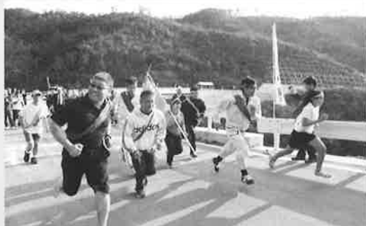
式典後に、開通を祝う駅伝大会が開かれました。