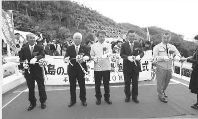
テープカットを行う関係者の方々