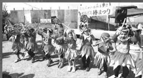
まつりオープニングを盛り上げた喜如嘉保育所のぶながや太鼓

また、舞台ステージでは喜如嘉保育所の所見らによるぶながや太鼓や、アイモコライブのほか、会場内では木工や貝殻ランプづくり、散策ツアーも行われました。