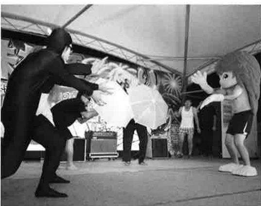
ヒーローぶながやのアクションシーン

初日は塩屋保育所、喜如嘉保育所 児たちによる元気溢れるステージを 皮切りに、のど自慢カラオケ大会、村 婦人会ステージ、2012年にブラジ ル・サンパウロのサンバカーニバルに、 日本人で初めての姉妹花形ダンサー