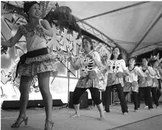
宮城姉妹と婦人会のダンスバトルが始まった～