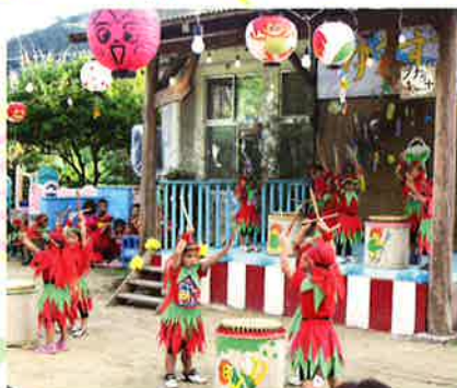
喜如嘉保育所のおながや太鼓

第33回ぶながやたすずみ会が7月5日、喜如嘉保育所中庭で開催され、ゆうぎやパーラック、ぶながや太鼓・しめ太鼓など、可愛い踊りを見せてくれました。同月26日、第33回ヤマシシっ子夕涼み会が塩屋保育所で開かれました。ひまわり組によるオープニングで始まり、ちびっ子踊り隊、パーラック、ヤマシシ太鼓などの踊りが披露されました。どちらの保育所もゲストとして招かれた愉快的照屋劇団による「ファッションズ」のダンスが披露され、こども達を楽しませていました。わが子や孫の踊りを見ようと父母や祖父母、地域住民が詰め掛け、かわいい踊りが終わるごとに大きな声援が飛び交い賑わいを見せていました。