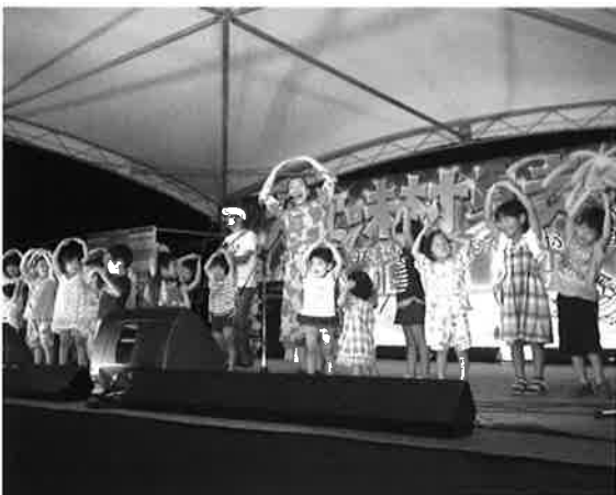
アイモコさんと子供達の大きなワッ!