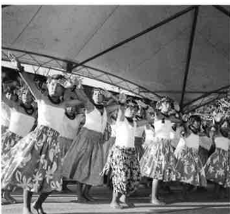
会場に涼しさを運んだ屋古フラガールズ

として出場した宮城姉妹による歌と 踊りによるステージショー、青年会ス テージではヒーローぶながやの戦い に多くの子どもたちが身を乗り出し て応援し、最後には誰もがヒーローに なれることを教えてくれました。 2日目は、ヒーシャー争奪綱引き大 会や青年会によるゲーム大会、永山 流太鼓塾、民謡愛好会、屋古フラガ ールズ、ジャズホリック、アイモコなど のステージイベントが行われました。そ の後、大宜味村の夏の夜空を、色とり どりの花火が打上げられ、来場者を 魅了しました。フィナーレは、まつり の主役である青年会が力強いエイ サーを披露し、演舞後は青年会と会 場が一つとなってカチャーシーを始め ると、熱気は最高潮に達しました。