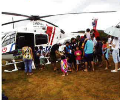
ドクターヘリ体験中

「森と湖に親しむ旬間」をキャッチフレーズに第4回大保ダムまつりが8月10日に開催されました。当日はコカ・コーラ主催の「森に学ぼう」でシークワサーと椿の苗木の育樹の体験活動、まつりイベントではハーリー大会やグラウンドゴルフ大会、ドクターヘリ、湖面カヌーツアーなどが行われ、村内外から訪れた行楽客で賑わいを見せました。グラウンドゴルフ大会では饒波区老人クラブチームが優勝、ハーリー大会ではチャンピオンの部:三村商工会青年部・辺土名婦人会チーム、しまんちゅの部:大川・結の浜・屋古団地チーム、親子の部:パワーギアチームが優勝しました。