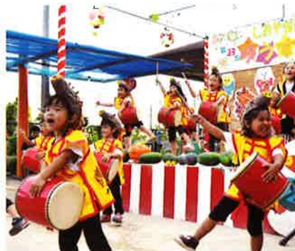
塩屋保育所のヤマシシ太鼓

第33回ぶながやたすずみ会が7月5日、喜如嘉保育所中庭で開催され、ゆうぎやパーラック、ぶながや太鼓・しめ太鼓など、可愛い踊りを見せてくれました。同月26日、第33回ヤマシシっ子夕涼み会が塩屋保育所で開かれました。ひまわり組によるオープニングで始まり、ちびっ子踊り隊、パーラック、ヤマシシ太鼓などの踊りが披露されました。どちらの保育所もゲストとして招かれた愉快的照屋劇団による「ファッションズ」のダンスが披露され、こども達を楽しませていました。わが子や孫の踊りを見ようと父母や祖父母、地域住民が詰め掛け、かわいい踊りが終わるごとに大きな声援が飛び交い賑わいを見せていました。