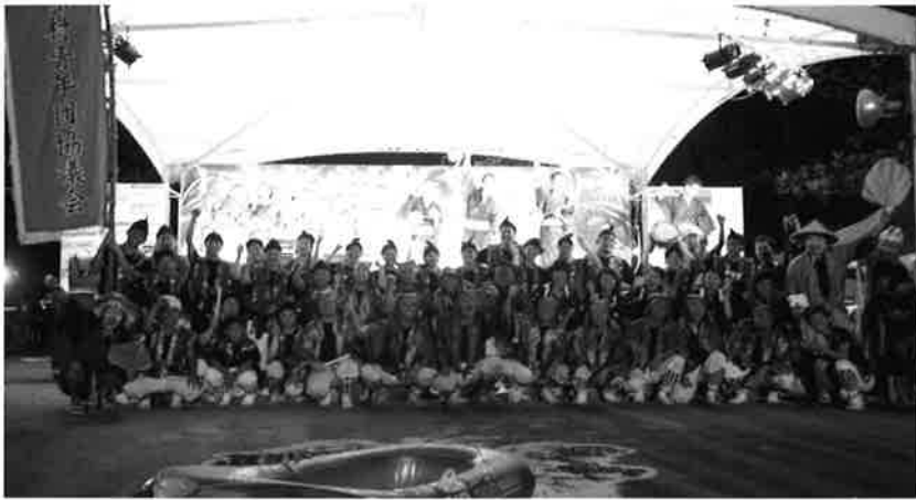
青年会メンバーのシークワースマイルや!!

第33回大宜味村青年会夏まつり・第23回大宜味村ふるさとまつり (主催：大宜味村夏まつり実行委員会)が8月10、11日の両日、 塩屋漁港内で開催されました。 まつりには、2日間で6000人余りが村内外から訪れ、 多彩な催し物を楽しみました。