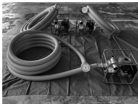
整備した緊急排水ポンプ

宝くじの社会貢献広報事業で一般財団法人 自治総合センターが実施しているコミュニティ助成事業(消防団育成助成事業)を活用し、国頭地区行政事務組合消防団では、緊急排水ポンプを3台整備しました。この資機材を活用し、大雨等による災害から、住民の生命・財産を守れるよう努めてまいります。