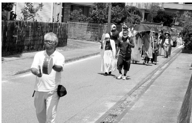
屋古から兼久浜へ

旧盆明けの最初の亥の日にあたる8月31日(火)、国の重要無形民俗文化財に指定されている「塩屋湾のウングミ」が、昨年に続き新型コロナウイルス感染症拡大防止として規模を縮小し、神事のみ行われました。