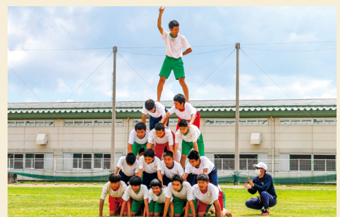
▲中学生による組体操

9月17日(金)、大宜味小学校・中学校の運動会が新型コロナウイルス感染症拡大防止として規模を縮小し、体育発表会として午前と午後に分かれて開催されました。午前は小学生によるプログラムとして、1・2年生の可愛い「ダンス玉入れ」、3・4年生の「千変万化」、最後は5・6年生のエイサーが披露されました。午後は中学生の「いぎみんピック」と題した発表が全生徒によるエイサーに始まり、男子による気合の入った組体操、女子による息の合った「リズムダンス」、全生徒による「総力リレー」と披露され、かけつけた家族の方々を楽しませていました。