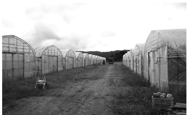
▲事業で整備した強化型ハウス