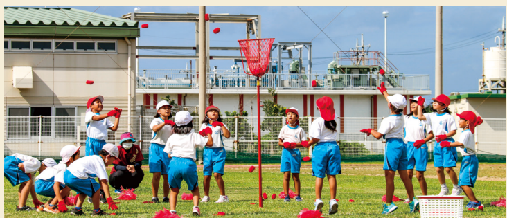
▲小学1・2年生によるダンス玉入れ