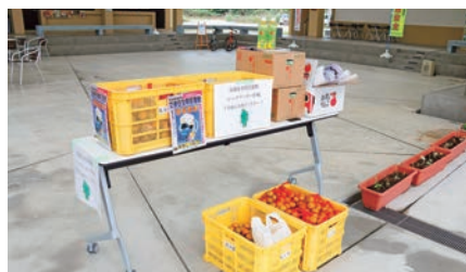
シークワサー作戦の様子