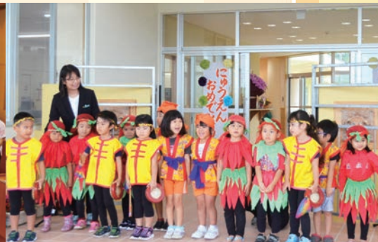
おおきみこども園 落成式