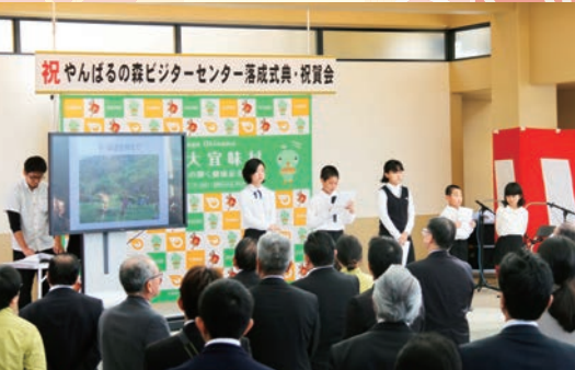
やんばるの森ビクターセンター グランドオープン