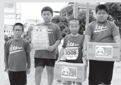
チームdeトリムの部(3km) 1位 大宜味結GutsチームT(タイム差28秒)

4月21日(日)に「第41回塩屋湾一周トリムマラソン大会」(主催:同実行委員会、共催:琉球新報社)が、塩屋湾一帯にて開催されました。曇り空の下で行われた大会でしたが、ランナーたちは各給水所や沿道からの声援、パーランクーを叩いての応援に後押しされ、それぞれのペースで楽しそうに走っていました。今大会は、16.7km・9km・3kmの3コース合わせて823人が申込み、当日出走者のうち完走者は723人でした。