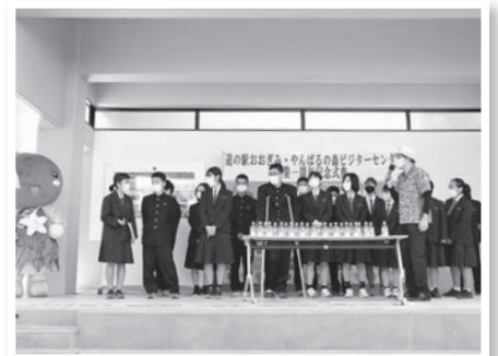
いぎみだし発売発表

株式会社ファーマーズ・フォレスト主催の第2部では、株式会社NTTドコモより5Gサイネージの贈呈式が行われ、デモンストレーション形式で機能の説明がされました。5Gサイネージは販売所に設置され、大宜味村の特産品を調べられる他、搭載されたカメラにより使用者に適した商品を提示してくれる機能があります。