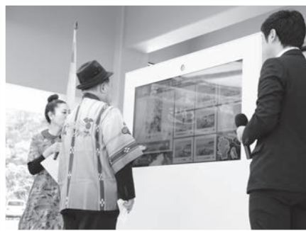
5Gサイネージの実演