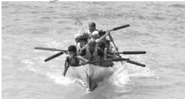
う願ファーレー(根路銘・上原区海神祭)