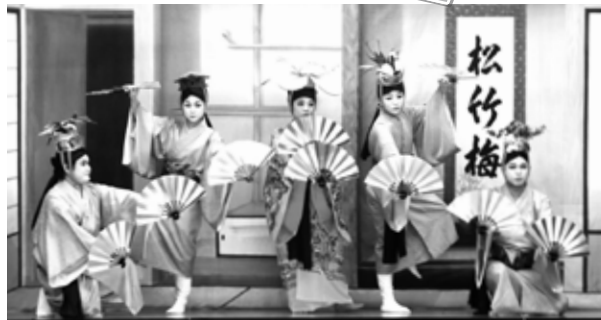
五福の舞(根路銘・上原区豊年祭)