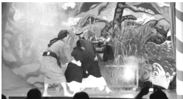
大主(津波区豊年祭)