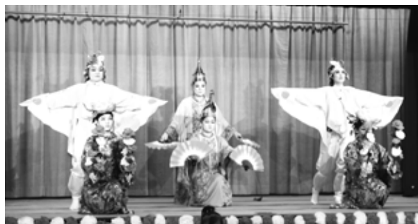
平和(謝名城区豊年踊り)

8月下旬から10月上旬にかけて、地域の豊作・豊漁や区民の健康などを祈願する海神祭や豊年祭が開催されました。9月19日、20日に根路銘・上原区海神祭・豊年祭、9月26日に津波区豊年祭、10月10日には謝名城区豊年踊りがそれぞれの区で行われました。根路銘・上原区では初日にう願ファーレーや婦人エンサー、2日目の豊年祭では子ども達による「ていんさぐの花」や貫花、前之浜、日傘踊り、五福の舞、高平良万才などが披露されました。津波区では津波城で坊主と大蛇との格闘を表す「大主」や様々な余興、謝名城区では子ども会によるエイサーや獅子舞、七福神、平和、史喜劇の隈雲国師、高砂といった伝統の踊りが披露されました。(※塩屋湾のウングミと饒波区、塩屋区の豊年祭は広報「大宜味」10月号No.247にて掲載しています。)