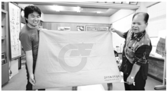
村長から村旗贈呈