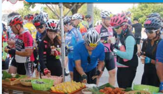
10日:道の駅おおぎみの様子