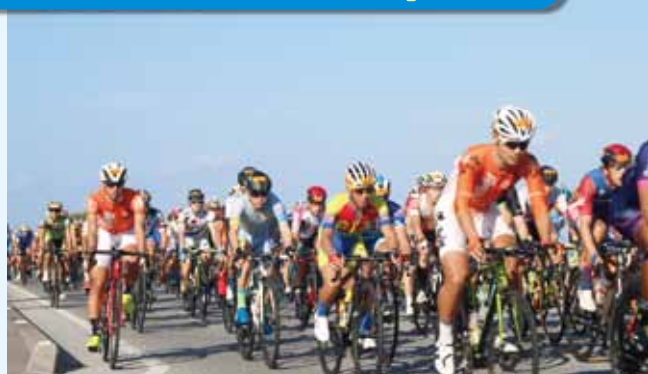
11日:大宜味関門を通過する選手たち

11月10日(土)・11日(日)、沖縄本島北部地域において、「第30回記念『ツール・ド・おきなわ2018』大会」が開催されました。10日の市民サイクリング部門では、約800名の参加者が休憩所の「道の駅おおぎみ」を訪れ、用意されたシークワサー入りサーターアンダギーなどで栄養補給を行う姿が見られました。11日のレース部門では、国内最高峰となる「男子チャンピオンレース210km」などが開催され、大宜味村の国道58号線沿いでも、選手たちが繰り広げる熱いレースを観戦することができました。