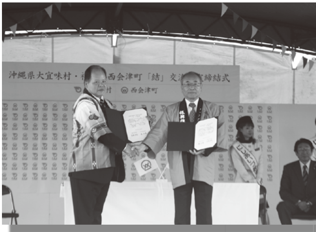
締結後に握手を交わす宮城村長（左）と薄町長（右）