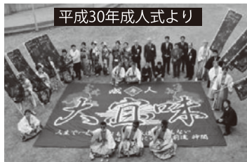
平成30年成人式より

成人に達した新しい門出の祝福と将来の幸福を祝いたいと思います。新成人者、御父兄並びに関係者のご参加を宜しくお願ひします。