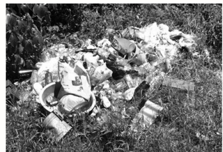
▲大宜味村内における不法投棄の現状

「不法投棄は絶対許さない」といった強い意志を持ち、私たち村民の共有問題として協力し合い、不法投棄のない美しい大宜味村を目指していきましょう!