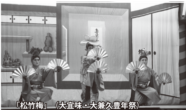
「松竹梅」(大宜味・大兼久豊年祭)