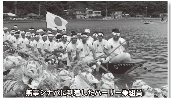
無事シナバに到着したハーリー乗組員

旧盆明けの最初の亥の日にあたる9月4日(火)、国の重要無形民俗文化財に指定されている「塩屋湾のウングミ」が、塩屋湾と周辺地域で行われました。今年は祈願やお供え物が多くなる「ウグワンマール(祈願年)」にあたり、田港や屋古では祭祀に訪れた人が神人から盃や餅を頂き、健康祈願を行う様子が見られました。「塩屋湾のウングミ」で一番の盛り上がりを見せる「御願ハーリー」には、今年も多くの人が集まり、ハーリー後の奉納角力には地元の子も達が参加し、大人たちに見守られながら力強い角力を取っていました。