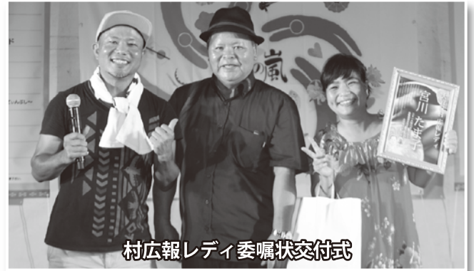
村広報レディ委嘱状交付式