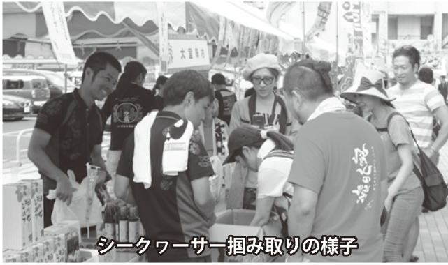
シークワサー掴み取りの様子