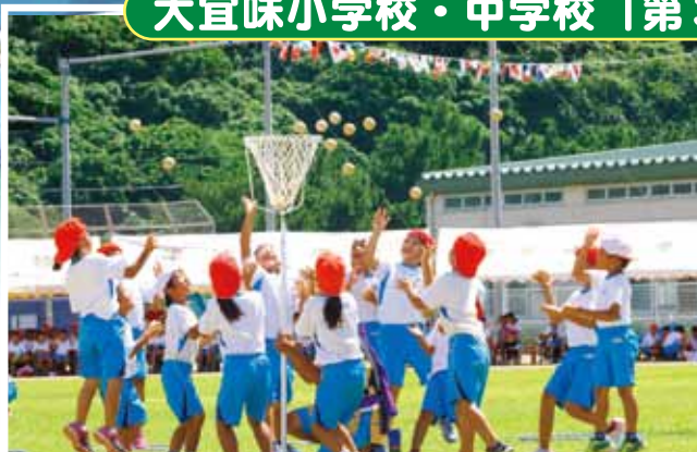
小学1・2年生による玉入れ・ダンス