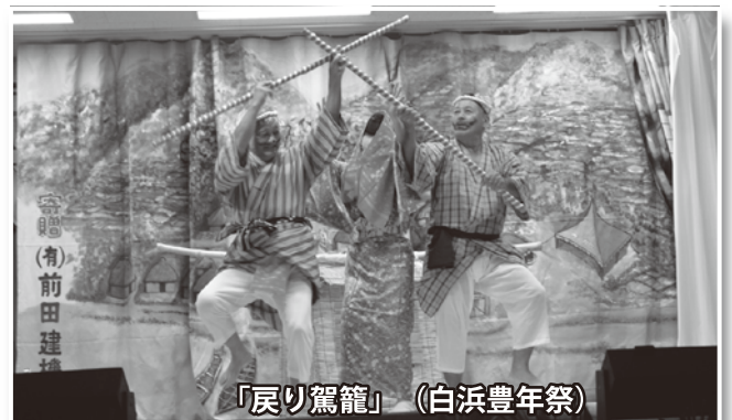
「戻り駕籠」(白浜豊年祭)

9月8日(土)、大宜味アサギマーにおいて「大宜味・大兼久豊年祭」、白浜区公民館において「白浜豊年祭」、根路銘海岸において「根路銘・上原海神祭」がそれぞれ行われました。豊年祭では、地域の行事を盛り上げるために子どもから大人までが日々練習を重ね、本番では、息の合った演舞や華麗な舞を見せていました。「根路銘・上原海神祭」の御願ハーリーでは、降っていた雨も上がり、力強い櫓さばきを見ることができました。この日は村内各地において、五穀豊穡や区民の健康、地域の発展などを祈願する1日となりました。