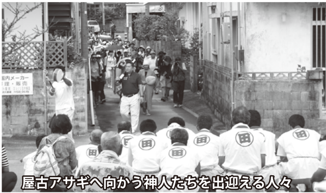
屋古アサギへ向かう神人たちを出迎える人々