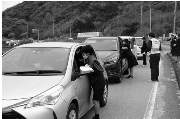
シークワサー作戦の様子