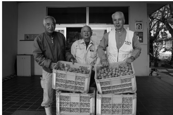
シークワサーの寄贈

12月21日(火)、津波のガタ原・交通安全記念碑前において、「令和3年度 年末年始の交通安全運動」大宜味村シークワサー作戦]が行われました。今回のシークワサー作戦は、新型コロナウイルス感染症拡大防止の対策としてマスクの他に手袋を着用し、小中学生と共に運転手へ交通安全の呼びかけとシークワサーの手渡しを行いました。