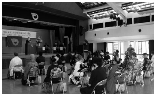
成人者代表あいさつ