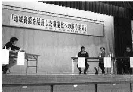
体育館で行われた「地域資源を活用した事業化への取り組み」