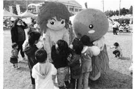
おおぎみシーちゃん、ぶながやとの交流タイム