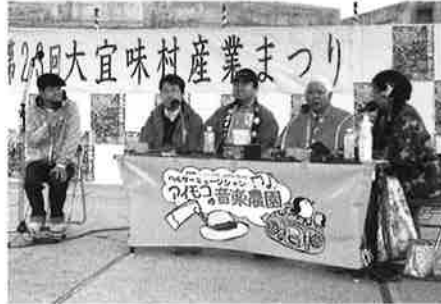
生放送「アイモコの音楽農園」