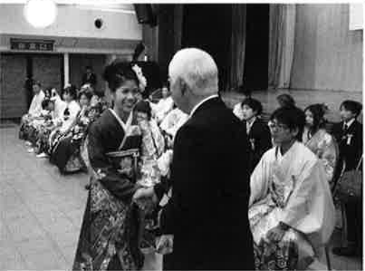
新成人に声を掛けながら 記念品を渡す島袋村長