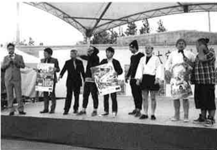
よしもと沖縄ラフ&ピースステージ