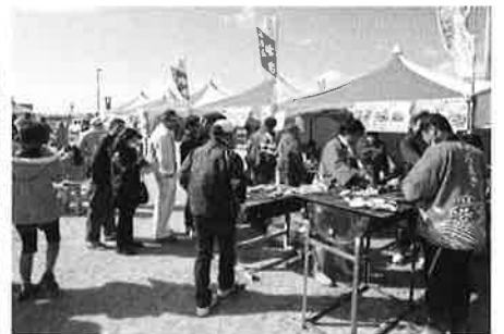
カキやホタテ料理で大人気