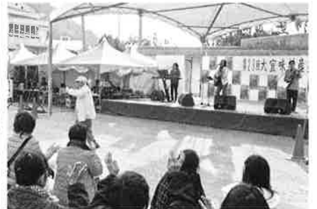
来場者も踊り出すほど盛り上がった「かくやひも」ライブ