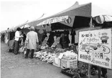
アツタイグワでとれた自慢の野菜を販売