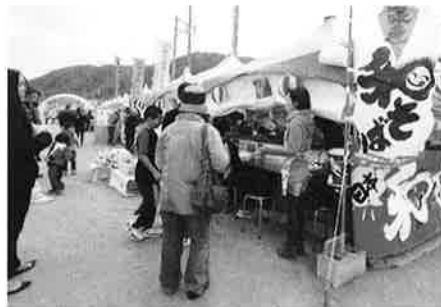
今年1番早い新蕎麦の販売