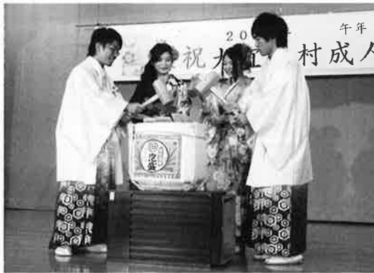
鏡割りで交歓会の幕開け