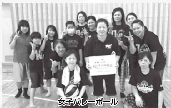
女子バレーボール