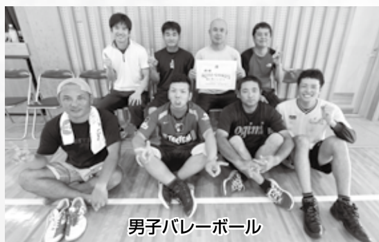
男子バレーボール