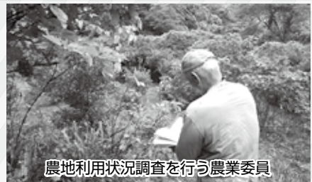
農地利用状況調査を行う農業委員

この調査は8月1日から10月末までの予定です。ご理解・ご協力をよろしくお願いします。