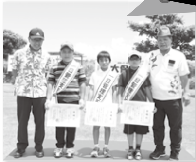
△大保ダム一日支所長