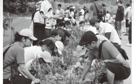
コカ・コーラ「森に学ぼう」in 大宜味村