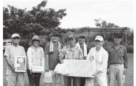
グラウンドゴルフ大会団体優勝の「にるみ会」

今年は、県内のダムの貯水率が過去10年で1番低い数値を記録し、ダムに対する県民の注目が集まりました。大保ダムの貯水率も心配されましたが、短期間でまとまった雨が降ったことにより、開催日には80%を上回るほどに回復しました。ダムまつりでは、湖面カヌー体験や湖面遊覧、ダム堤内見学会といったダムに触れあえる体験イベントや、箸やランプをつくるモノづくり体験を行いました。また、「コカ・コーラ『森に学ぼう』in 大宜味村」では、ダム敷地内に新たにサンダンカの苗を200株植樹しました。来年で10回を数える大保ダムまつり。今後も、森林やダムに触れ合う機会を提供していきます。