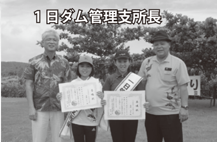
1 目ダム管理支所長