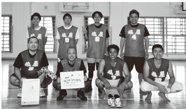
男子バスケットボール優勝：塩屋