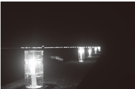
塩屋湾に灯されたロウソク