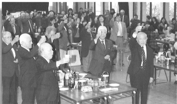
▲村社会福祉協議会20周年を祝って「かりい」の合図で乾杯