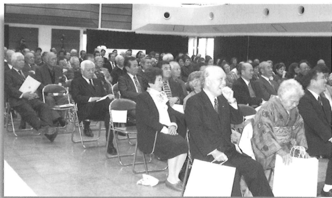
▲講演会は来場者の笑い声で溢れていました