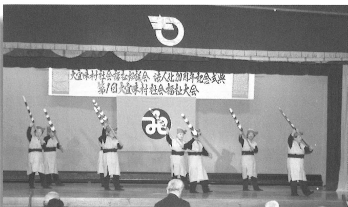
▲塩屋中山会による「塩屋の宝」