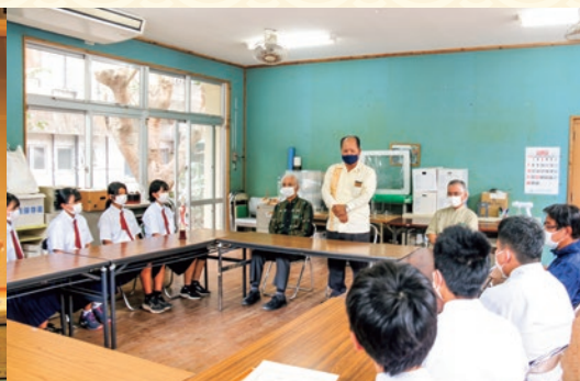
中学生の活躍、活動報告