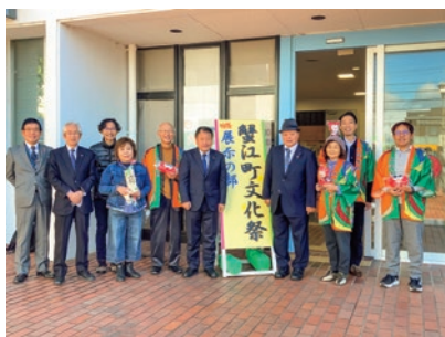
会場前での記念撮影