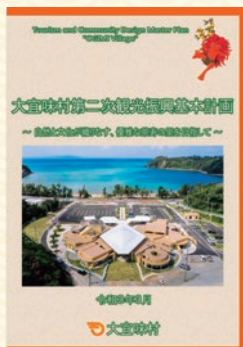
(表紙) 第二次観光振興基本計画