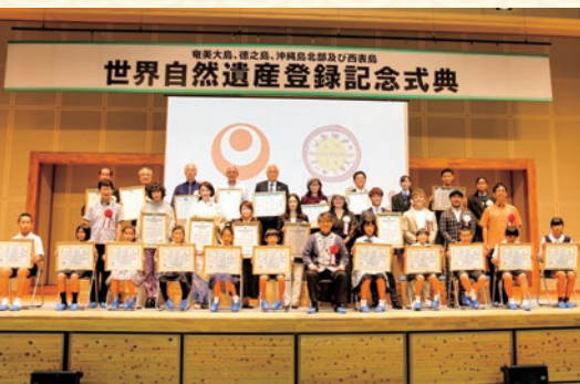
世界自然遺産登録記念式典