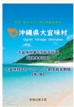
(表紙) 大宜味村第5次総合計画 後期基本計画