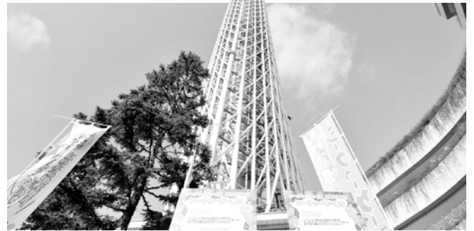
会場のすぐ上には東京スカイツリー