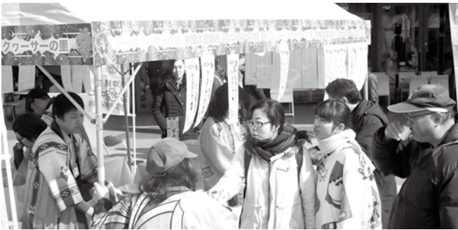
大宜味村産シークワサーをPR