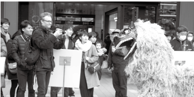
迫力のあった獅子舞演舞