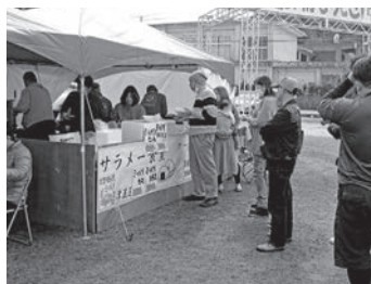
飲食テナントに並ぶ来場者