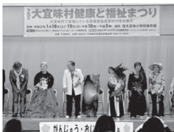
ファッションショー