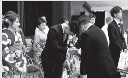
村長から記念品を贈呈され 握手を交わす新成人