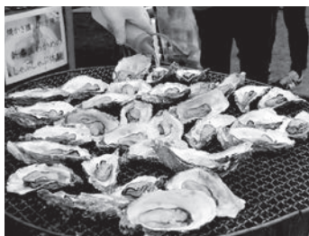
宮城県石巻市の牡蠣