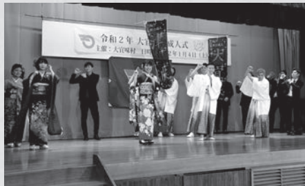
新成人による余興