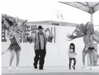
宮城姉妹とサンバ