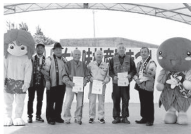
シークワサー品評会