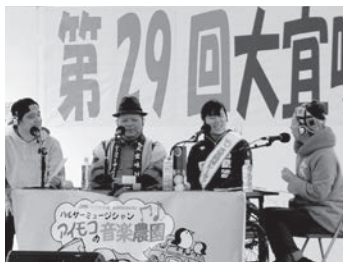
アイモコの音楽農園in産業まつり