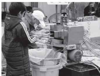
サトウキビ 体験コーナー