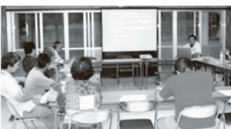
▲宮城公民館での説明会の様子

今後、説明会で挙げられた意見や提言を基に、全体構想に修正を加え、案を決定していきます。これからの貴重なご意見があれば、提言して下さいますよう宜しくお願いします。