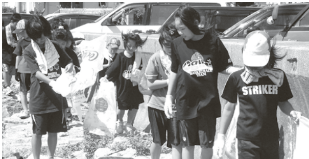
▲海岸沿いを清掃する子どもたち