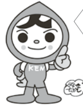
人権イメージキャラクター 人KENまもるくん