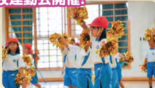
▲小学1・2年生によるリズムダンス

9月17日(土)、大宜味小学校・中学校の運動会が開催されました。今年は悪天候のため規模を縮小して体育館での開催となりました。中学生女子はリズムダンス、中学生男子は組体操で会場を沸かせ、小学1・2年生による可愛い「リズムダンス・かけっこ」、小学3・4年生による元気いっぱい「リズムなわとび」、最後は小学5・6年生と中学生全員による獅子舞の演舞と力強いエイサーを披露し、来場者を楽しませていました。