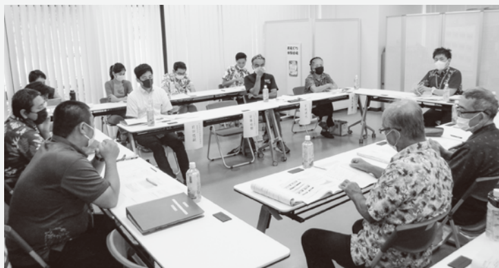
▲第1回策定委員会の様子