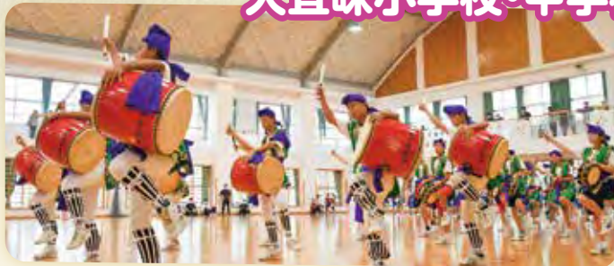
▲小学5・6年生と中学生によるエイサー