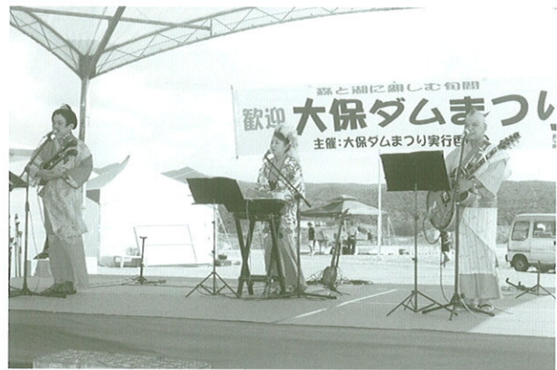
▲トークと歌で会場を湧かせたとうるるんてんライブ