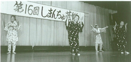
女装と滑稽な踊りで会場を沸かせた津波老人会