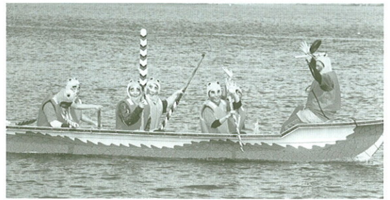
カエルの衣装で参加し大会を盛り上げた「あたびゃー」チーム