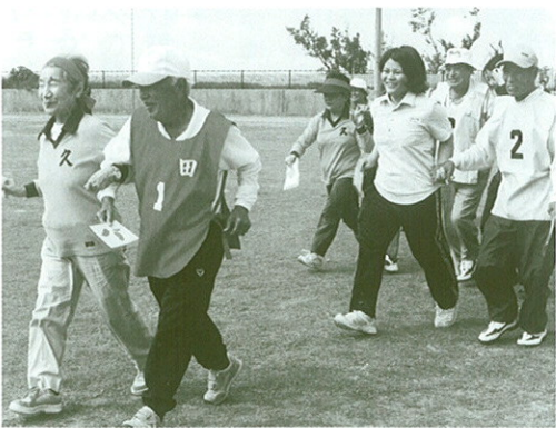
「恋人さがしゲーム」で手を繋ぎゴールを目指す参加者ら

昼食時間には、大宜味小学校4、6年生がエイサーを披露し、会場からは盛大な拍手が沸き起こりました。