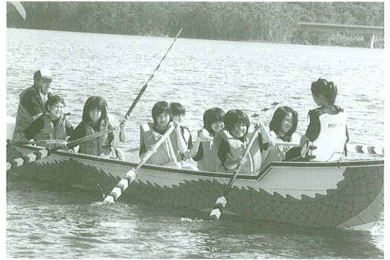
小学生チームも水しぶきをあげて湖面を疾走しました