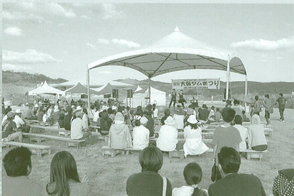
▲大勢の人が多彩な催しを楽しみました