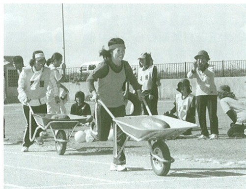
一輪車に乗せて、すぶいを運ぶなどユニークな種目「ありんくりんリレー」