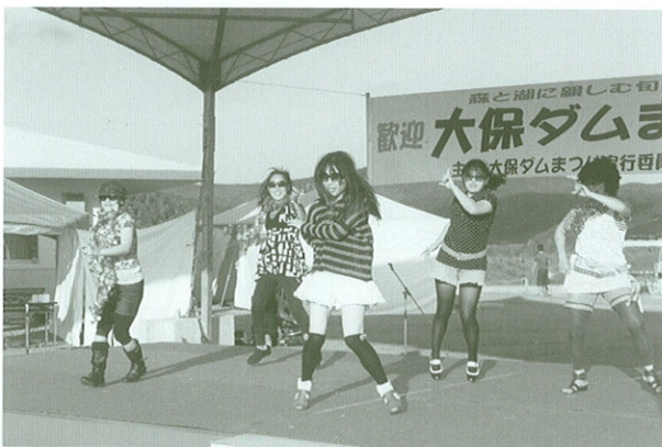
▲軽快なダンスを披露した村婦人会