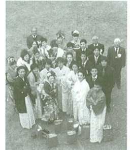
▲平成23年成人式より