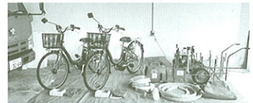
整備した資機材：軽可搬消防ポンプ1台 (台車付属機材含む)・電動自転車2台・ 携帯用発電機1台

これらの資機材は、国頭地区女性防火クラブや自主防災組織の初期消火訓練や火災予防に活用します。