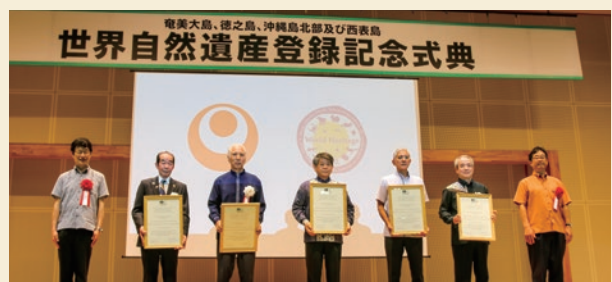
▲授与を受けた各村代表