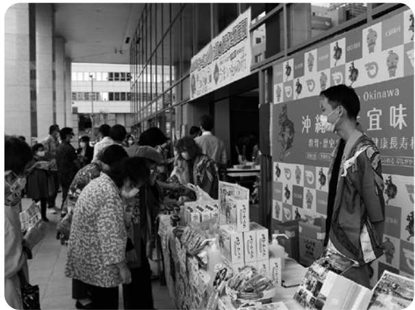
▲全国のうまいもの市

10月23日(土)~24日(日)には、那覇市パレット久茂地にて「ありんくりん市(主催:県商工会連合会)」が、11月5日(金)~7日(日)には、那覇市久茂地の沖縄タイムスビルにて「全国のうまいもの市(主催:ジャンボツアーズ)」が開催され、大宜味村(大宜味村PRイベント実行委員会)も両イベントにてPRブースを出店しました。