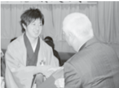
島袋村長と握手を交わし記念品を受け取る新成人たち