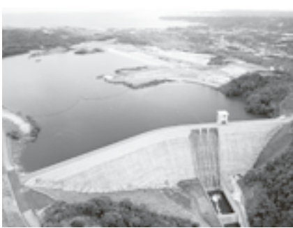
上空からみた大保ダム