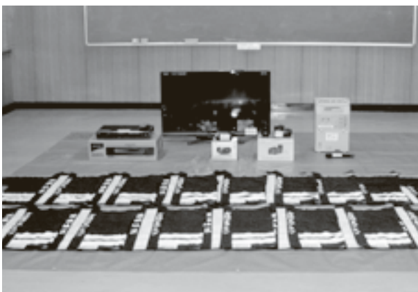
今回整備した防火広報用視聴覚資機材

このことに関するお問い合わせは、国頭地区行政事務組合消防本部予防課 電話 41-5100まで