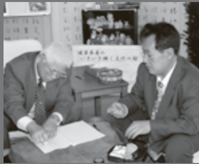
協定書に押印する島袋村長

1月よりメンテナンスをいれて、2月の後半頃をメドに加工施設の再開に向けて取り組んでいく予定であります。