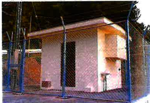
謝名城増圧ポンプ場