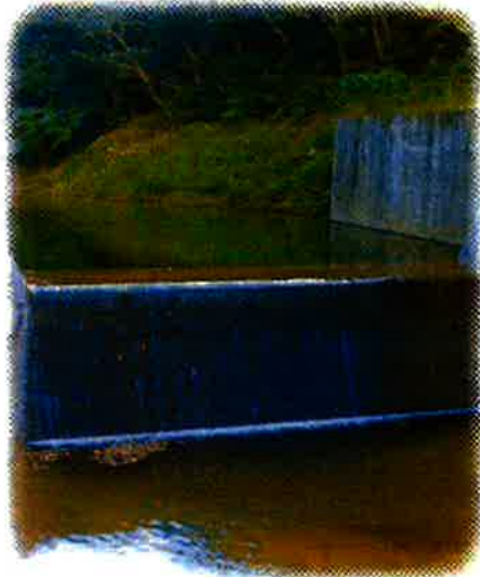
平南川支流の取水堰