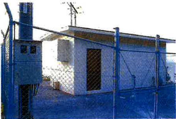
上原増圧ポンプ場