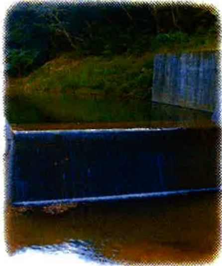
平南川支流の取水堰