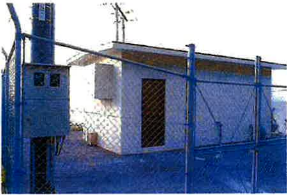
上原増圧ポンプ場