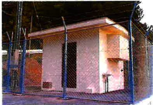
謝名城増圧ポンプ場