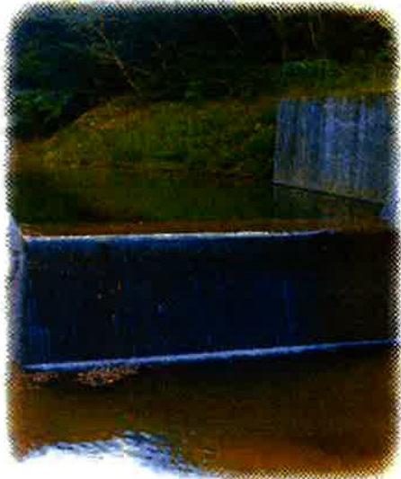
平南川支流の取水堰