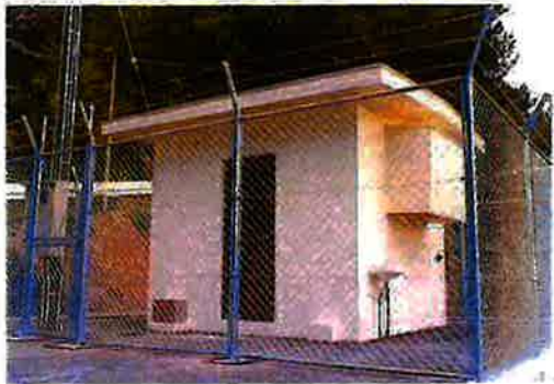
謝名城増圧ポンプ場