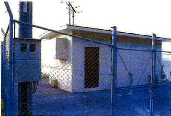
上原増圧ポンプ場