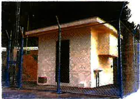
謝名城増圧ポンプ場