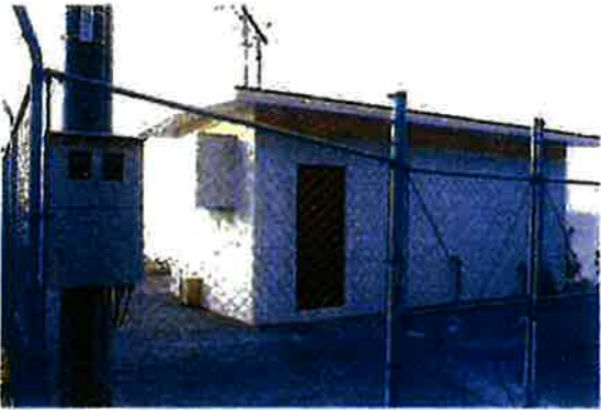
上原増圧ポンプ場