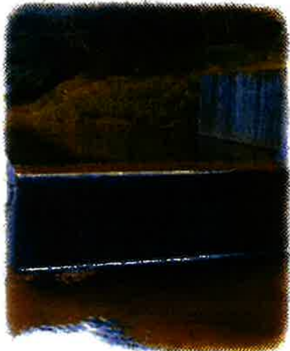
平南川支流の取水堰