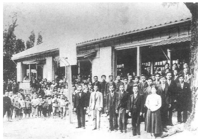
お宮にあった頃の津波校校舎落成式 1937（昭和12）年頃