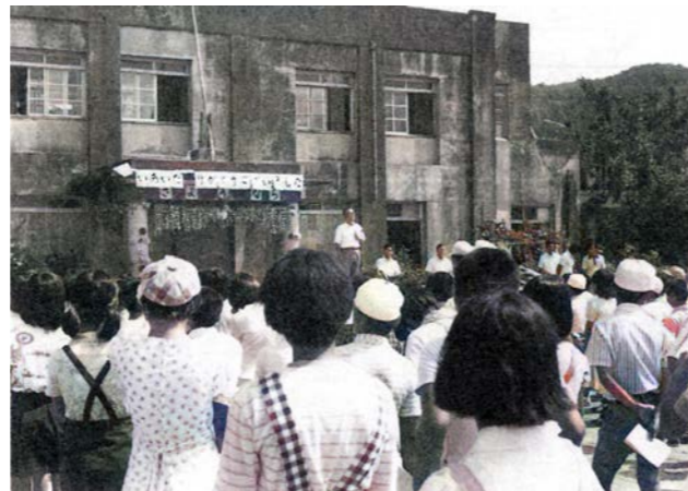
昭和5年竣工の旧校舎とお別れ式 塩屋校 1976（昭和51）年