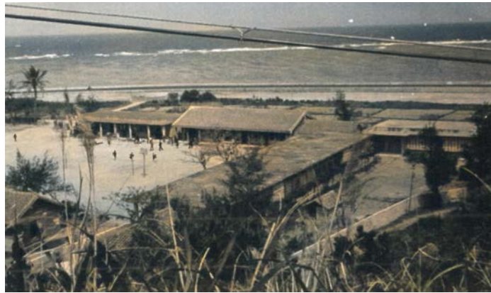
大宜味校全景 1955（昭和30）年頃