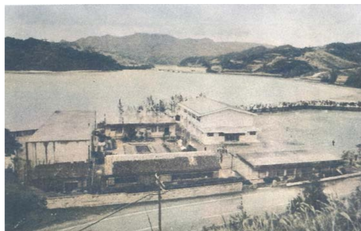
具志喜名原に移転後の校舎全景 津波 1965（昭和40）年頃