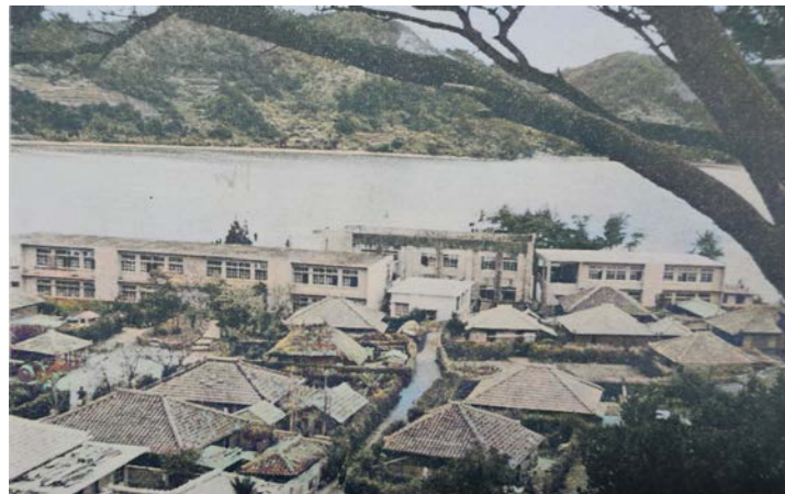
戦後の新校舎（左右） 塩屋校 1956（昭和31）年