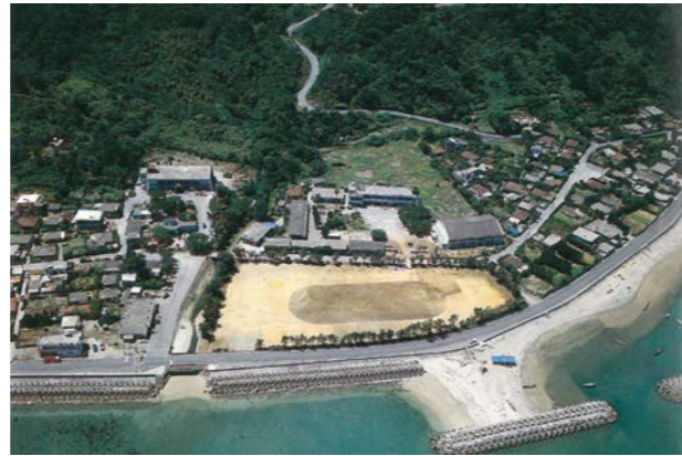
空から見た大宜味小学校全景 1983（昭和58）年