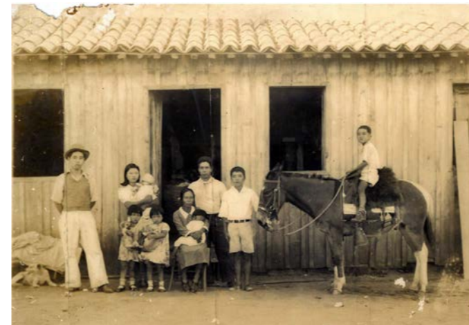
▲ブラジル