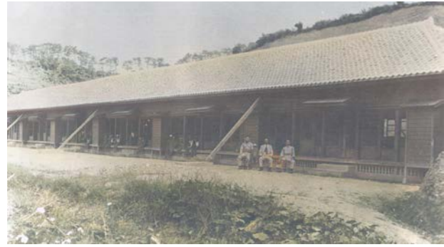
ハサマ（小字）に移築された喜如嘉校旧校舎 1947年頃