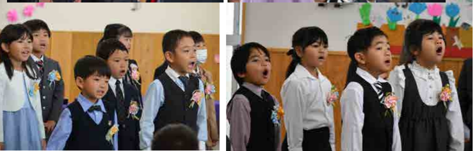
3月16日（木）、おおぎみこども園において令和4年度修了式が行われました。

ニコニコ笑顔で入場してきた修了生。式では元気にあいさつし、呼名された時も大きな声で返事ができるようになり、カッコいいお兄さん、お姉さんに成長した姿を見せてくれました。