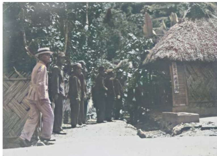
田嘉里集落第11班共同浴場 1942（S17）7月15日