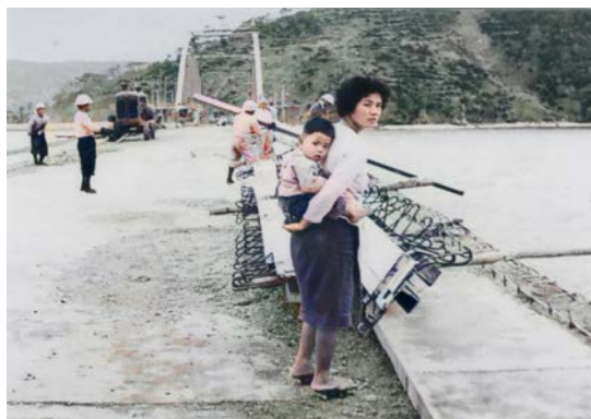
塩屋大橋の工事を見守る親子。 アーチがついて完成間近だ 1962（S37）年頃