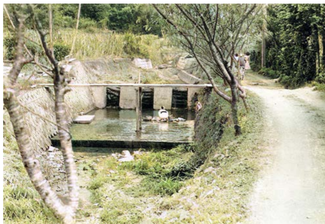
ミーゾーガーで洗濯をする婦人（喜如嘉）