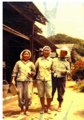
明るくたくましい 働き者のオッカーたち （田嘉里）