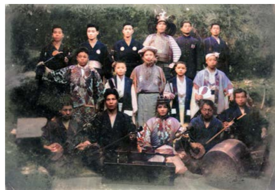
大正末期～昭和初期頃の謝名城豊年踊り