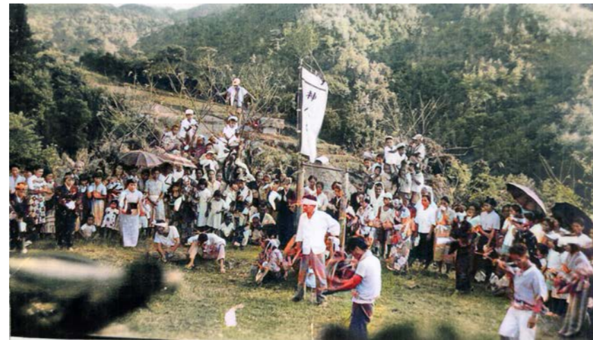
田嘉里のウシンデーク