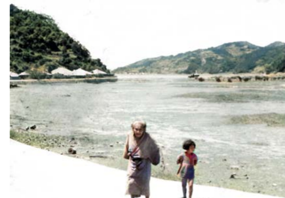
おばあさんと少女（大保）