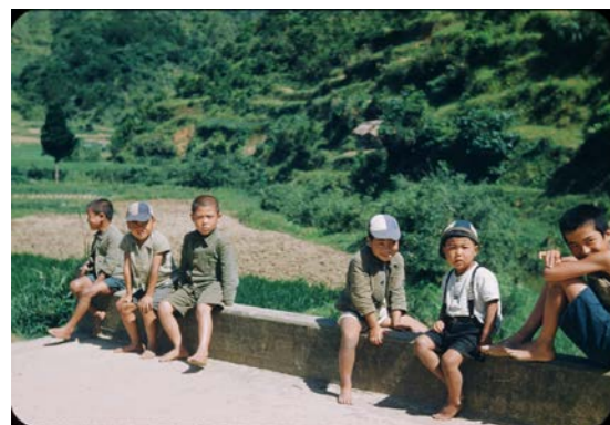
何して遊ぶ？橋に腰かけ相談中の謝名城の 子供たち