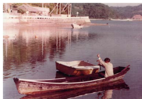
塩屋湾に浮かぶサバニ