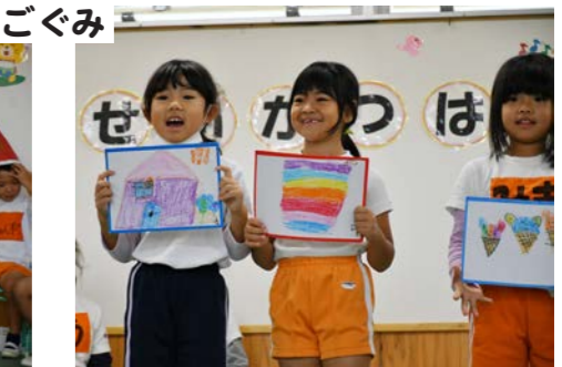
でいご組：まいにちがたのしいでいごぐみ