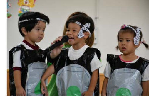
ちゅーりっぷ組：おすしバス