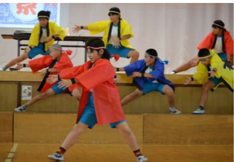
4年生：ちむDON!DON! 大宜味祭