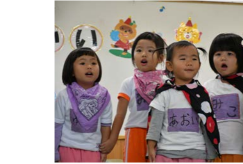
ひまわり組：グリーンマンのピーマン