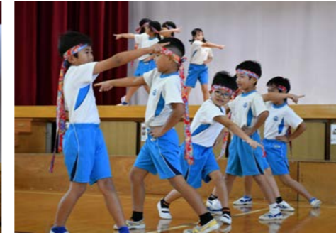
2年生：かがやけ、にじ