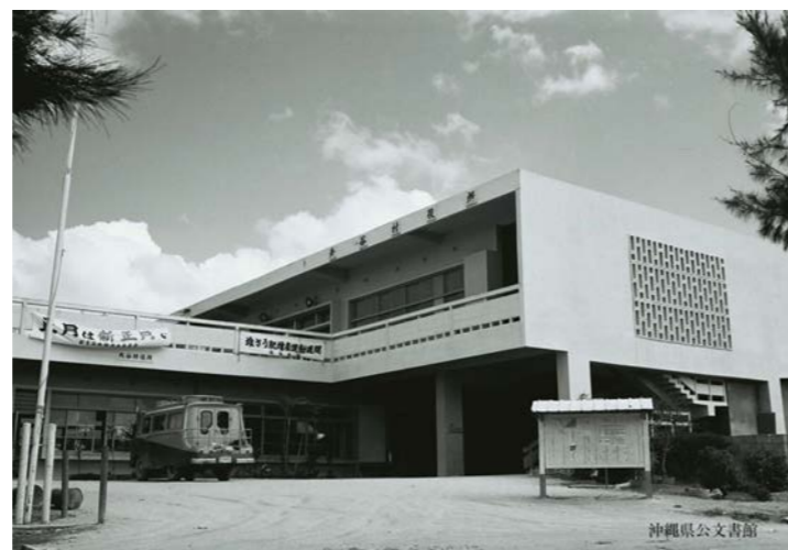
「正月は新正月で！」の横断幕がかかった北谷町役場 1963年