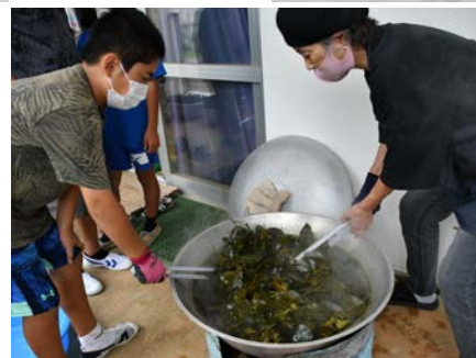
煮熟後、攪拌 原料に