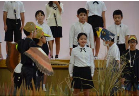
5年生：大造じいさんとガン