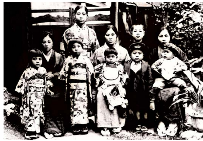
晴れ着を着てお正月の記念撮影 饒波

1872（明治5）年11月9日に発せられた「改暦の詔書（※太陰暦を廃し太陽暦を採用すること。1年を365日としそれを12月に分け4年毎に閏年をおくこと、1日を24時間とすること、旧暦の明治5年12月3日を新暦の明治6年1月1日とすること）」によって、社会的には旧暦から新暦に切り替わったにも関わらず、沖縄では今でも暮らしの中に旧暦と新暦の二つの流れがあり、両方とも欠かせないものになっている。