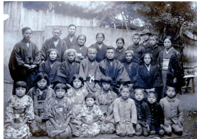
親戚が一同に会し正装で記念撮影 喜如嘉

『大宜味村史 通史』（1979年）年表を見ると、1942（昭和17）年「この年より村内の諸行事新暦にあらたまるとあり、それを裏付けるように、『大宜味村の戦争証言集』（2015年）では、「その日はお盆の日に当たっていたので、山でお盆の祈願をしてから下山した」という山中へ避難した人々の話が複数採集されており、村史年表にも1945（昭和20）年7月15日「住民下山する」と記されている。しかし、今ではお盆は旧盆が定着していることも面白い現象である。