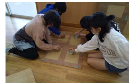
紙が完全に乾いたら磨いて完成

12月5日（月）～7日（水）、19日（月）、大宜味小学校6年生が自分たちの卒業証書づくりを行いました。7年目となる卒業証書作成。バショウとシークワサーを使って紙漉きを漉き、卒業証書の紙を作ります。自分で作る世界で1枚だけの卒業証書。どんな仕上がりになるかは自分たち次第です。