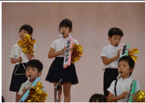
1年生：できるようになったよ