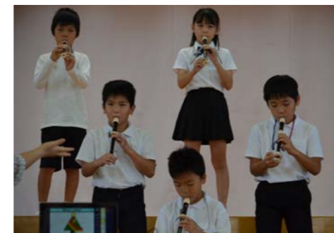
3年生：はじめてのチャレンジ