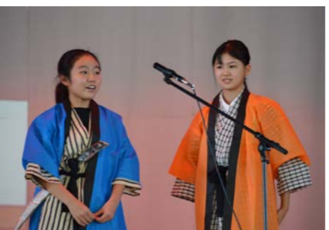
6年生：今につながる歴史