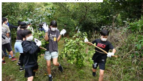
シークワサー枝葉採集