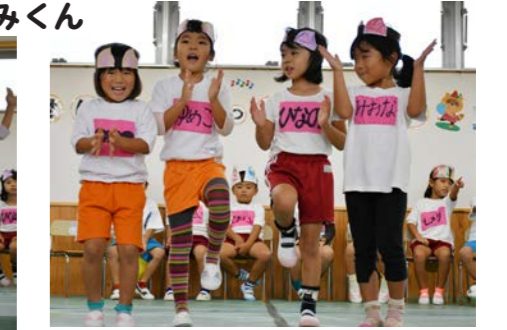
ゆうな組：ともだちほしいな おおかみくん