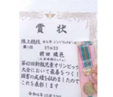
1位：前田琉邑 記録 37m33cm