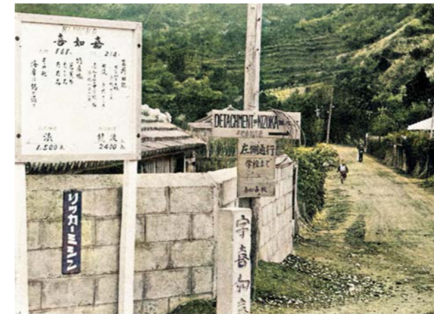
▲1960（S35）年代 この頃は各集落入口にこのような案内板がかかっていた