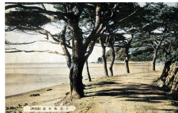
▲松並木が美しい大宜味街道 塩屋 1940（S15）年代