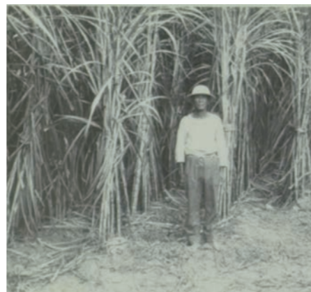
▲立派に育ったサトウキビの畑と男性 江洲 1964年