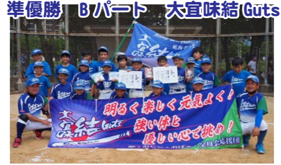
準優勝 Bパート 大宜味結Guts