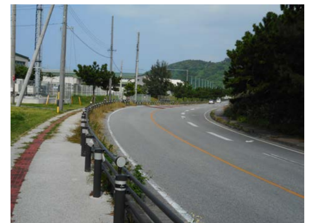
▲国道58号 塩屋から安根へ向かうカーブ 2011（H23）年