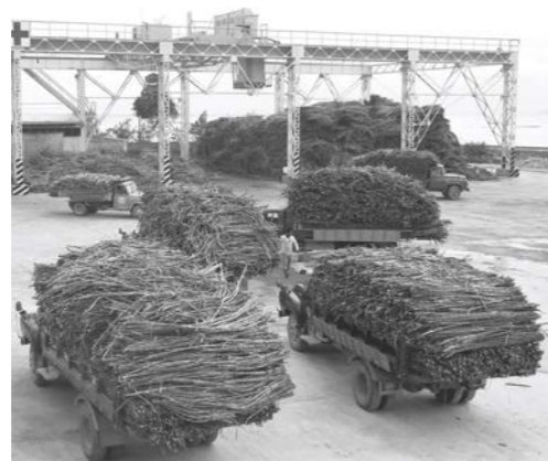
▲中部製糖のサトウキビ搬入状況。やんばるではもっと山盛りで積んでいた 1966年