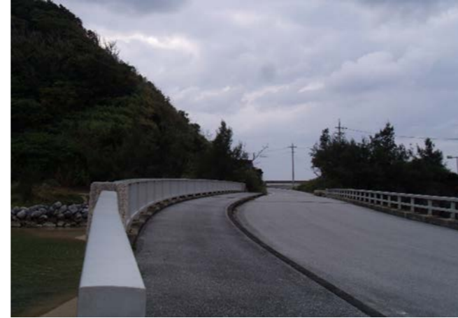
▲国頭村浜側から 58 号方面を見る 田嘉里 2016（H28）年