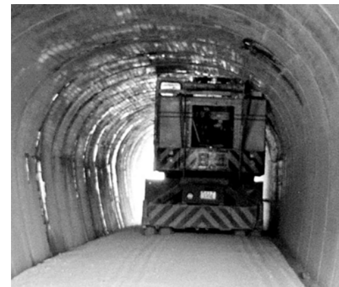
▲国頭村の座津武トンネル内で立ち往生した大型車両 砂利敷の道路にタイヤがめり込んでいる 1971年