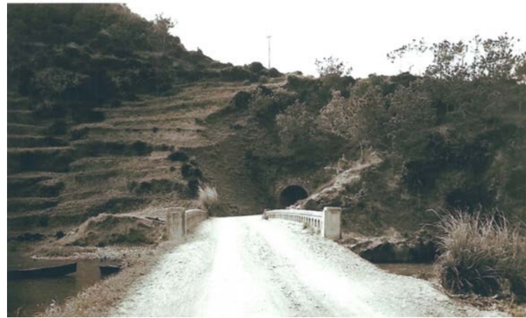
▲国頭村浜側から見た大國トンネル 田嘉里

1919（大正 8）年にサバ崎で開削が着手され翌年完成、1921（大正 10）年、辺土名まで郡道が開通した。トンネル開通で辺土名以北の道路整備も大きく前進し、経済、教育、福祉など多くの分野に恩恵をもたらした。