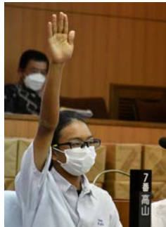
7番 高山 莉生 議員