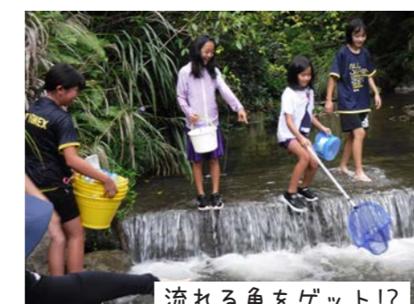
流れる魚をゲット!?