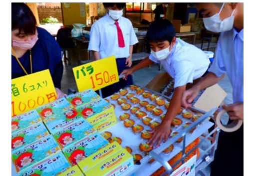
準備もめかりなく…

クワッサーCUPは8月より、やんばるの森ビジターセンターで販売を開始します。1個150円（税別）、6個入り1箱で1000円（税別）。8月のお盆の際にはぜひ「クワッサーCUP」でご先祖様を迎えてください。