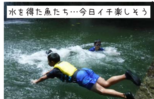
水を得た魚たち…今日イキ楽しそう