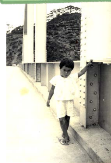
▲塩屋大橋と同級生の女子（塩屋/1960年代）▲