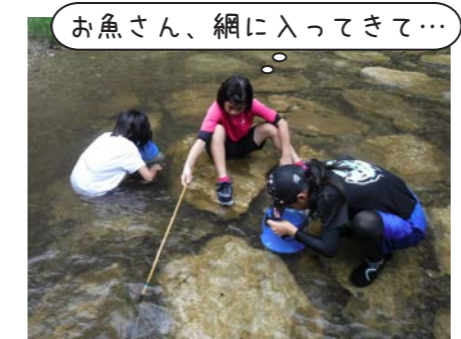
お魚さん、網に入ってきて…