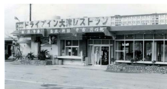
▲ドライブイン大津レストラン（津波）