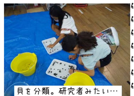
貝を分類。研究者みたい…

気になる捕獲数は??少人数ながらも93匹捕獲、そのうち7種の名前を判明することができました。上出来!! さすが、5、6年生。種の判定はお見事。今年も立派な生き物図かんが出来そうです。楽しみに待っててね。