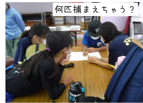
何匹捕まえちゃう?

新たな体制で早速開始!と思っていたのに、緊急事態宣言の発令などで活動は延期に次ぐ延期…。開催がのびのびになってしまいましたが、ついに7月17日（土）令和3年第1回「田嘉里川で生きものをつかまえて調べよう!!Part10」が開催されました。