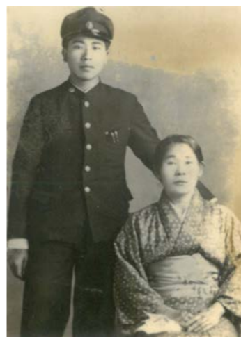
▲(上) 家族写真（根路銘/戦前）