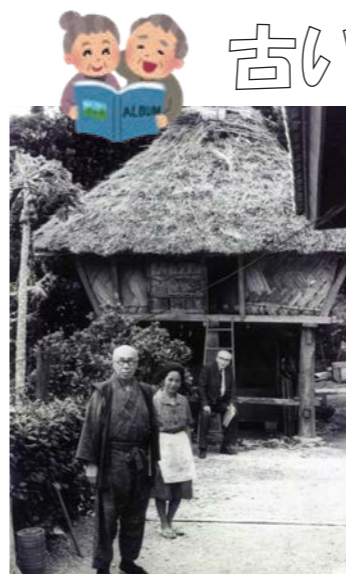
▲真謝の高倉（喜如嘉/1964年）

※大宜味村史写真集に収録する戦前～昭和の写真を集めています！景色・日常・人物・建物など、懐かしい写真をお持ちの方は村史までぜひご連絡下さい。