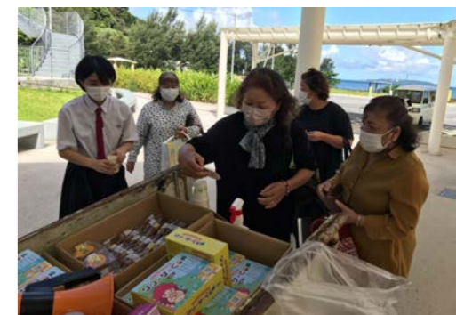
おかげさまで大盛況♪