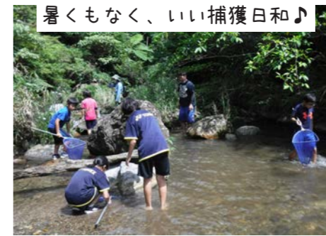
暑くもなく、いい捕獲日和♪