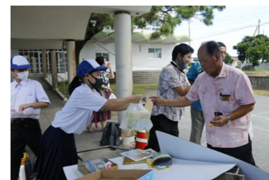
村長、ありがとうございます！