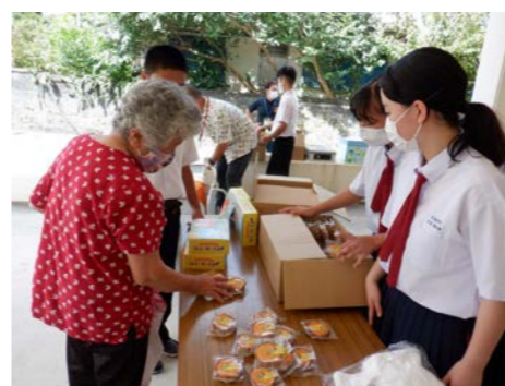
応援ありがとうございます！