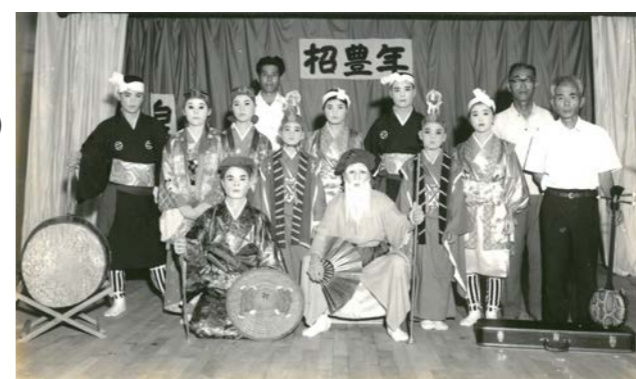
▲豊年祭（白浜/昭和47年）