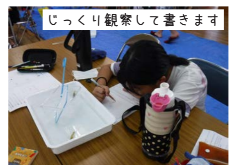
じっくり観察して書きます