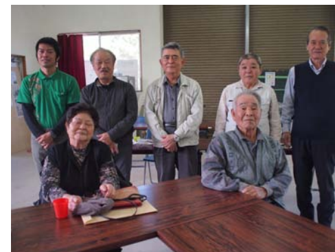
▲終了記念写真♪(江洲)

令和元年度第1回編さん委員会が2月27日（木）に行われました。当日は朝から「人と自然編」の聞き取り調査があり、編さん委員会は異例の18時開催となりました。