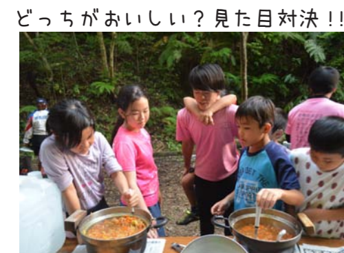
どっちがおいしい? 見た目対決!!

翌日はキャンプ場の片づけを終えて、田嘉里川へ…。次々に飛び込むわんぱくたち。キャンプでかいた汗もすっかり流せたようでした。