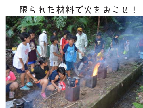
限られた材料で火をおこせ!