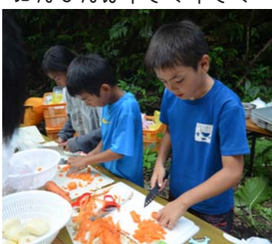
にんじんは小さく小さく

カレーに玉ねぎを入れないという血迷った班…。いやいや斬新なアイデアの班もいましたが、とにかくカレーはできあがり、焦げ付いたご飯も白い部分だけ盛り付け（おこげがおいしいんだけどな…）おいしい夕食をいただくことができました。苦労して作ったカレーは格別だったようです。