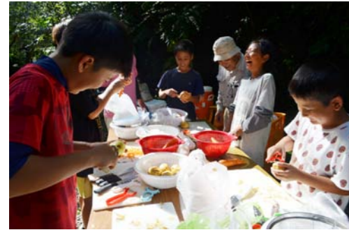
けが人続出!? カレーの下ごしらえ