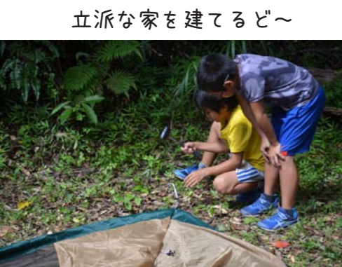
立派な家を建てるど〜

午後からはキャンプ♪4年生以上の団員が参加できる山でのキャンプ。もちろん電気もガスもありません。あるのは沢から流れてくる水くらい。ここに1晩過ごすためのテントを張り、炊事の火種となるマキを集め、夕食のご飯とカレーを自分たちで作ります。のんびりしてたらあつと言う間に夜になっちゃう!? 暗いと炊事はできないよ。さあさあ、みんなで協力してパパッと終わらせよう! と思っているのは大人だけ…。団員たちはあくまでも自分たちのペース。まっ、いいさ。泣きを見るのは自分達だからあまり口も手も出しませんp'へ' それぞれの得意分野や器用さを活かしてなんなく夕食までこぎつけた団員たち（もっと苦労すればいいのに…）。