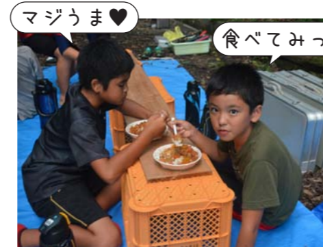
マジうま♡ 食べてみて