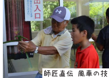
師匠直伝 風車の技