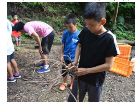
マキは大きさごとに分け、長いものは折ったり切ったりします