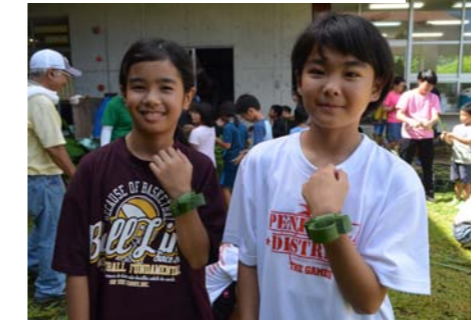
今年の新作ラインナップ♪