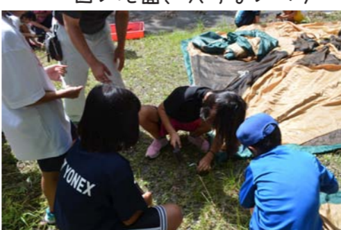
固い地面、入らないペグ…