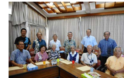
▲喜如嘉での終了記念写真（7/29・3回目）