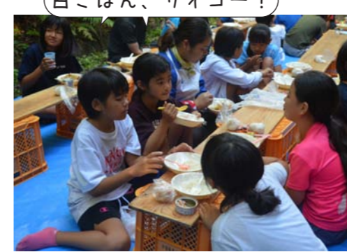
白ごはん、サイコー!