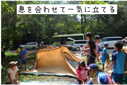
息を合わせて一気に立てる