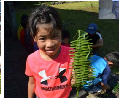
上手にできました♪