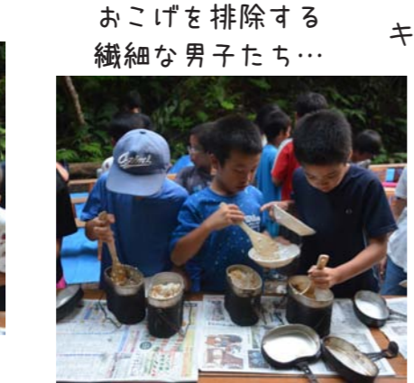
おこげを排除する 繊細な男子たち…