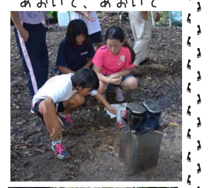
あおいで、あおいで