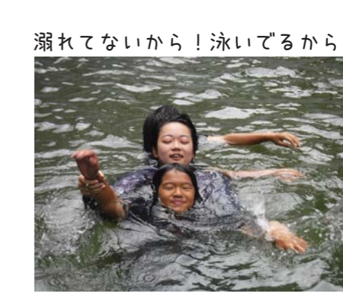
濡れてないから! 泳いでるから!