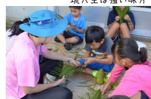
琉大生は強い味方!