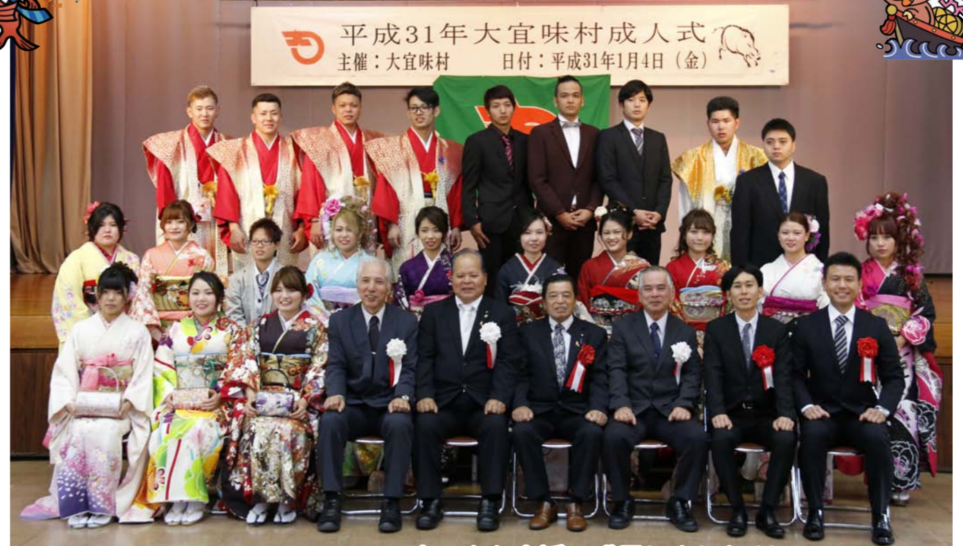
平成31年大宜味村成人式 主催：大宜味村 日付：平成31年1月4日（金）