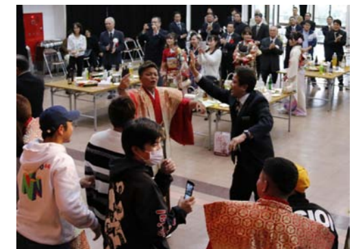
恩師の先生とカチャーシー!?