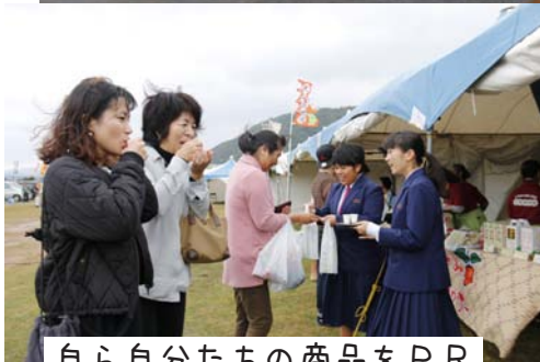
自ら自分たちの商品をPR