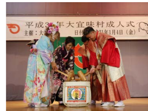
成人を祝して鏡開き♪