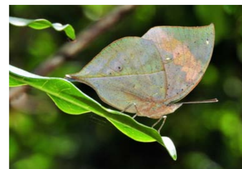
念願のコノハチョウに会えました♡

チョウの宝庫というだけあって次々に出現するチョウたち。始めは同じ黒いチョウにしか見えなかった種もポイントを聞き、次々に見分けて記録していきました。