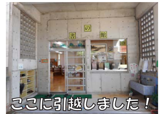
ここに引越しました！ （旧大宜味小図書室）