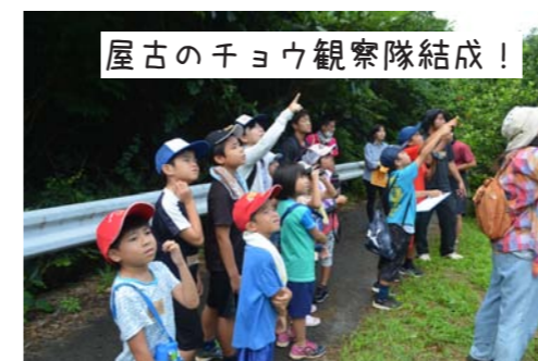
屋古のチョウ観察隊結成！