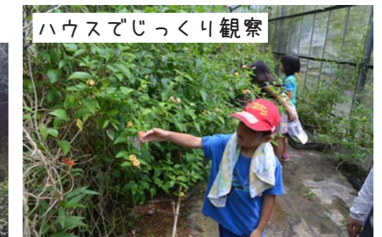
ハウスでじっくり観察