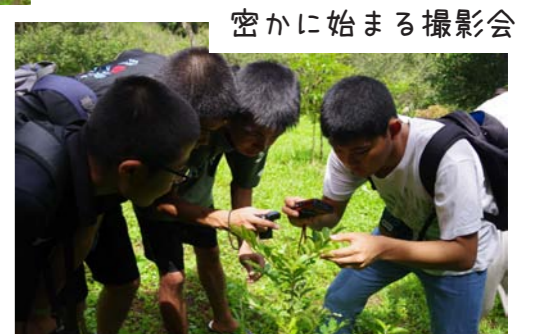
密かに始まる撮影会