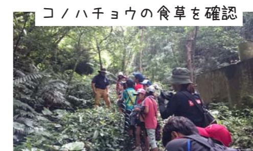
コノハチョウの食草を確認