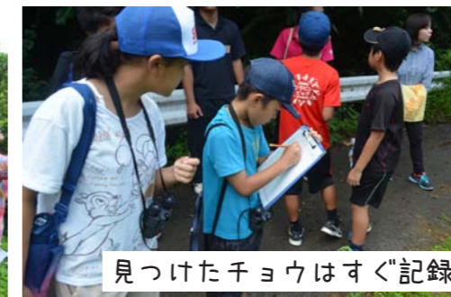
見つけたチョウはすぐ記録