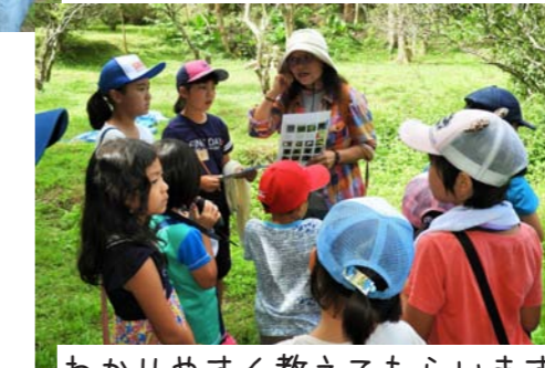
わかりやすく教えてもらいます