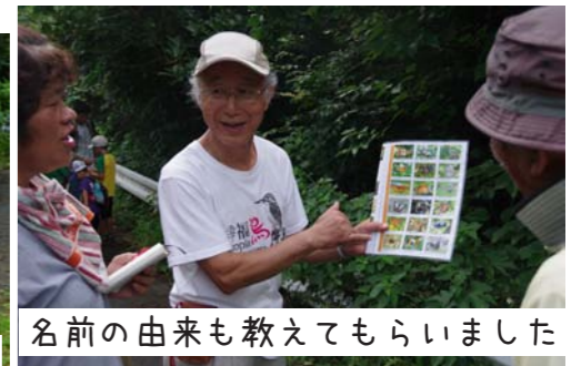
名前の由来も教えてもらいました