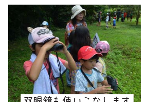
双眼鏡も使いこなします