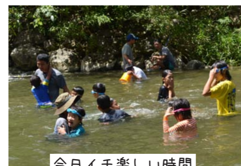
今日イ千楽しい時間