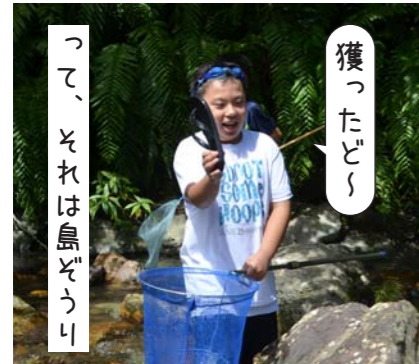
つて、それは鳥ぞうり