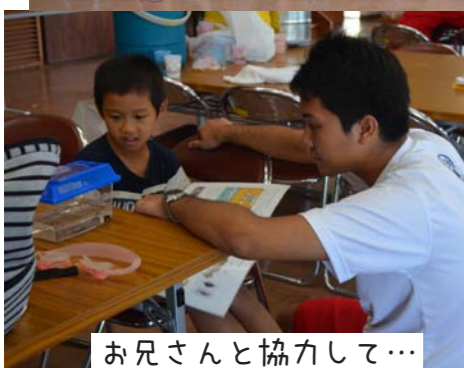
お兄さんと協力して...