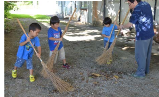
見よ!僕たちの竹ぼうきさばき