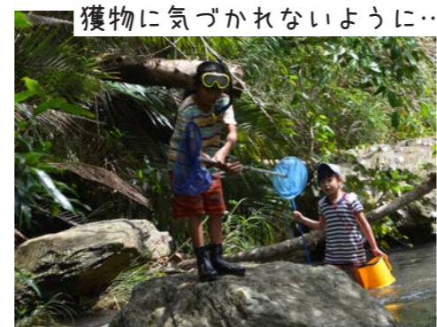
獲物に気づかれないように...