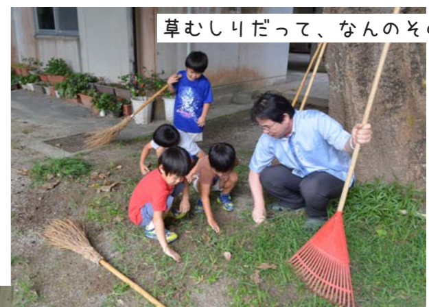
草むしりだって、なんのその!