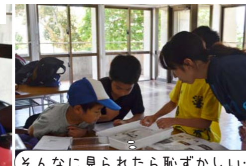
そんなに見られたら恥ずかしい...

7月1日（土）、平成29年度わんぱく体験団第2弾「田嘉里川の生きものをつかまえて観察しようPart7」が行われました。