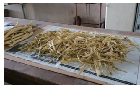
乾燥 本日はここまで

参加者のみなさんは作業の飲み込みも早く一人一人がてきぱきと動き、活動は順調。布の肌触りや大きさ、染めの見本を見てどの生地で何媒染にするか悩んだり、輪ゴムや板、ビニール袋を使って出来上がりを想像しながら染め分けをしたり、紙漉き用の枝の黒皮を黙々と剥いたり、手も口も動かし続けての楽しい作業となりました。