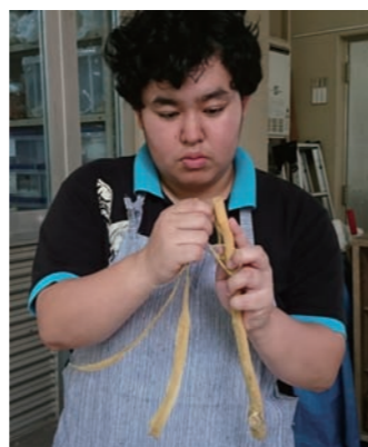
枝から皮を剥がす この時期はすると剥ける