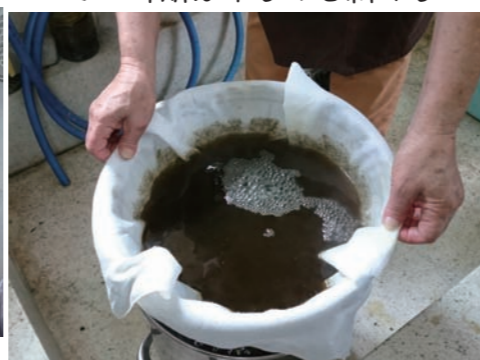
濾す 原料をたくさん使い 濃い染液にした