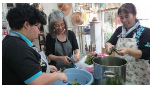
葉と細い枝を細かく切る