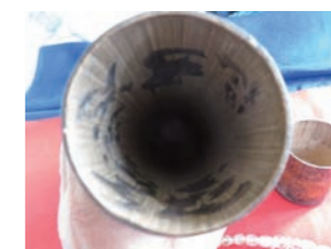
▲竹筒の内側に文字が書かれている