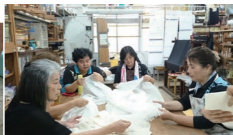
布選び オーガンジー、羽二重 ローシルク、リネン織絹ショール リネン織麻ショール、タイシルク から選んだ