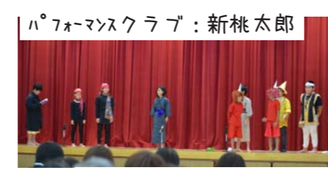
パフォーマンスクラブ：新桃太郎