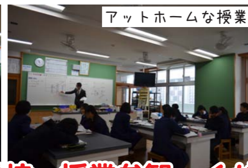
アットホームな授業