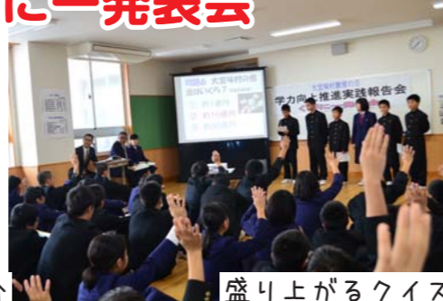
盛り上がるクイズ

午前中に行われた中学校の授業参観。いつもの授業も家族が見に来ていることで少し落ち着かない様子の生徒たちでしたが、3年生の受験生と面接官になりきっての面接の挑戦や1年生の討論ゲームなど工夫のこなされた授業が繰り広げられ、参観に来た家族も楽しんでいるようでした。