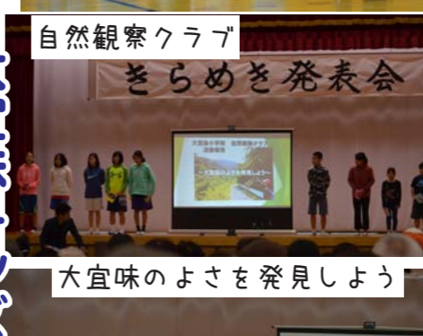
大宜味のよさを発見しよう