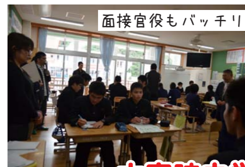
面接官役もバッチリ