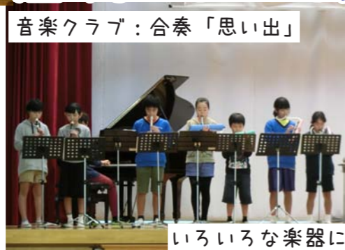
音楽クラブ：合奏「思い出」