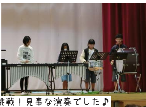
いろいろな楽器に挑戦！見事な演奏でした♪