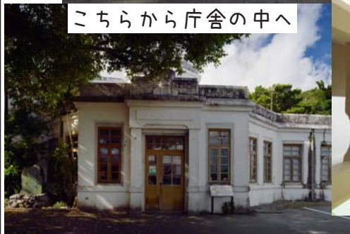
こちらから庁舎の中へ