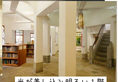
光が差し込み明るい1階

昨年10月21日に国の文化審議会から重要文化財（建造物）に指定するよう文部科学大臣に答申された「大宜味村役場旧庁舎」が平成29年2月23日の官報（国の機関紙）に文部科学大臣から重要文化財（建造物）指定することが告示され、正式な指定となりました。