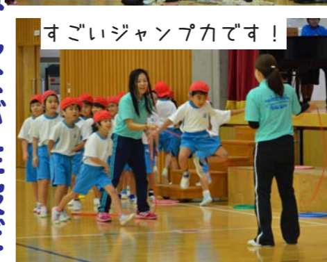
すごいジャンプ力です！