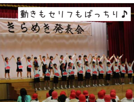
動きもセリフもばっちり♪