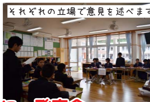
それぞれの立場で意見を述べます