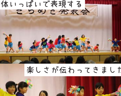
体いっぱい表現する