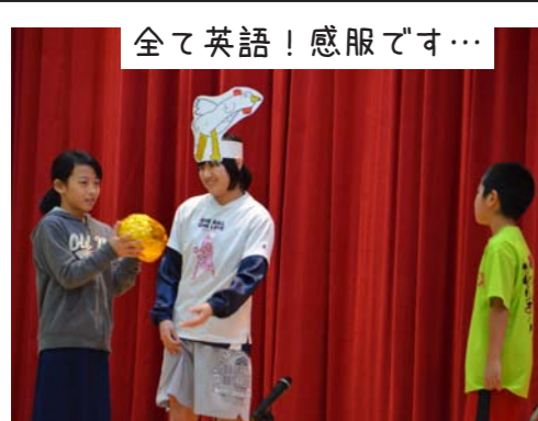
全て英語！感服です…