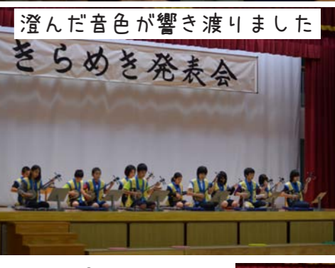
澄んだ音色が響き渡りました