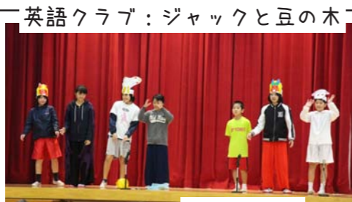
英語クラブ：ジャックと豆の木