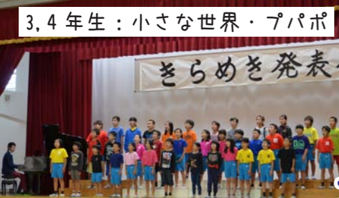
3,4年生：小さな世界・プパポ