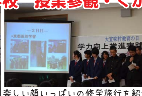
楽しい顔いっぱいの修学旅行を紹介