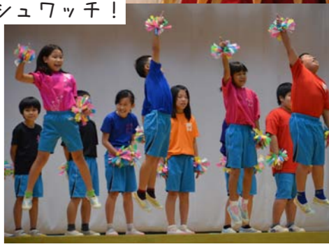
3年生：みんなちがって みんないい