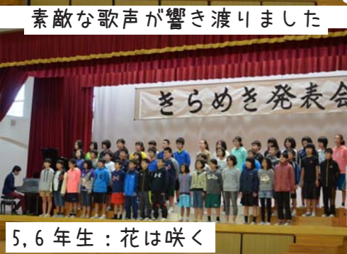
素敵な歌声が響き渡りました