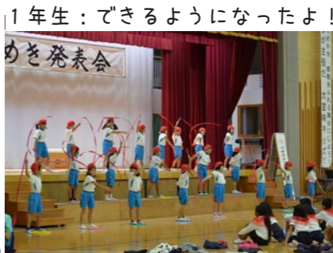
1年生：できるようになったよ！