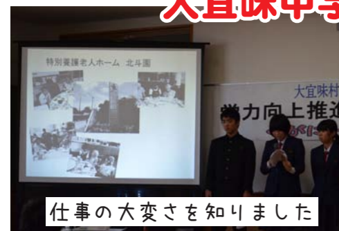
仕事の大変さを知りました