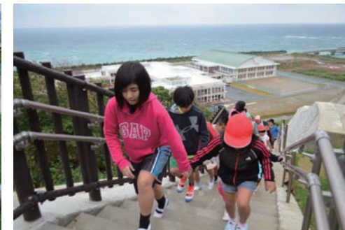
6年生は1年生と一緒に…