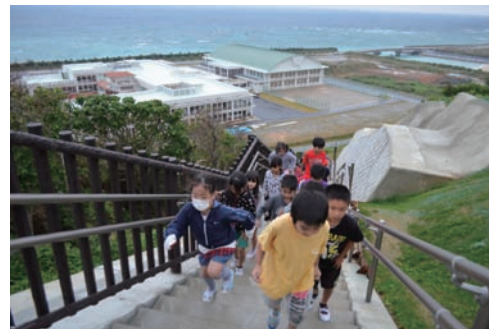
先頭集団が上がってきました