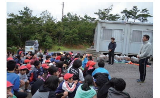
全員無事、到着しました！

地震や津波はいつどこでくるかわかりません。避難する場所を頭に入れておき、すぐに逃げられるような体力をつけるよう心がけましょう。