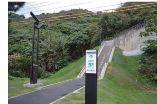
この階段を上ります

242段ある階段を上りきると、今度は念蒲エーガイ線を避難地になる「みのり」まで徒歩での移動。