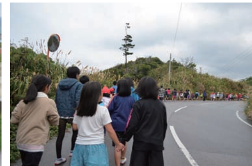
ここから長い道のりが