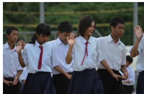
楽しんだもの勝ちでしょ♪