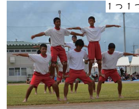
1つ1つの技が光ってます!