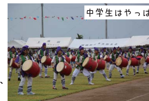
中学生はやっぱり格好いい♪

地域のみなさんと大きな輪を作って踊ったみんなで踊ろうや小中学生が一丸となって挑んだエイサー、低学年のかわいいダンス、中学生の力を見せつけてくれた組体操など、今までにはないボリューム満点、見どころ満載の運動会となりました。