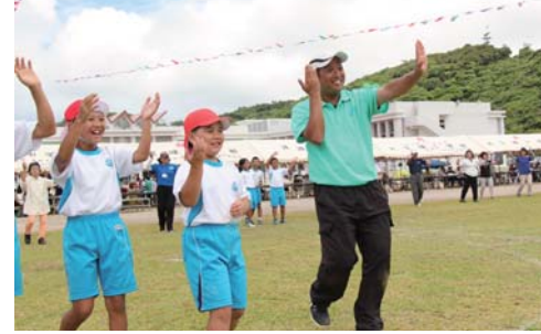
みんなが一丸となって会場に大きな輪ができました！