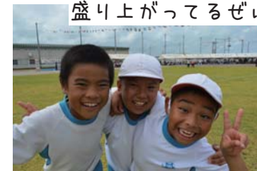
盛り上がってるぜい