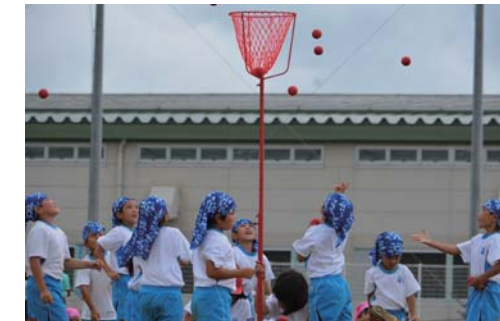
こちらになります!