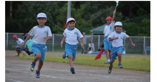
仲間がたくさんいるって素晴らしい！