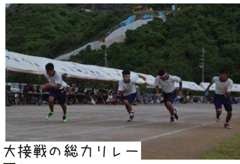
大接戦の総力リレー 最後まで順位が入れ替わりました