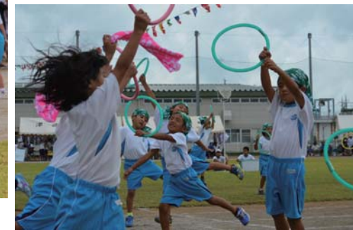
とにかく楽しんでます!!