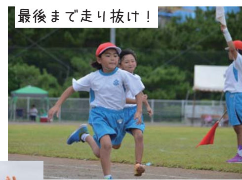
最後まで走り抜け！