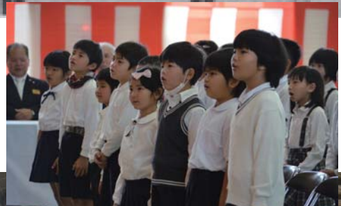
体育館中に響く校歌、圧巻です