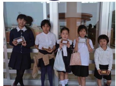
みんな大好き、塩屋の味♥