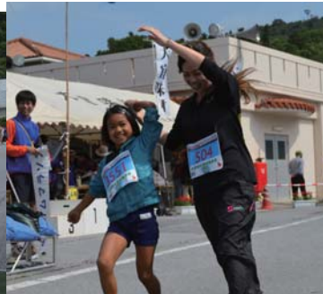
晴れやかにゴール!!