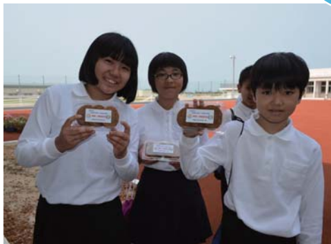
お祝いの大判焼き♪

4月3日（日）、大宜味小学校開校式、開校移転式典、開校移転落成祝賀会が真新しい大宜味小、大宜味中学校で行われました。