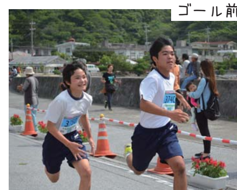
ゴール前の白熱した戦い!! 俺が先にゴールするんだ〜!!