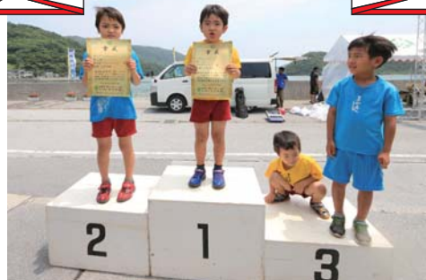
1位 喜如嘉ブルーウェーブ 2位 喜如嘉ブルーウェーブゲンキーズ