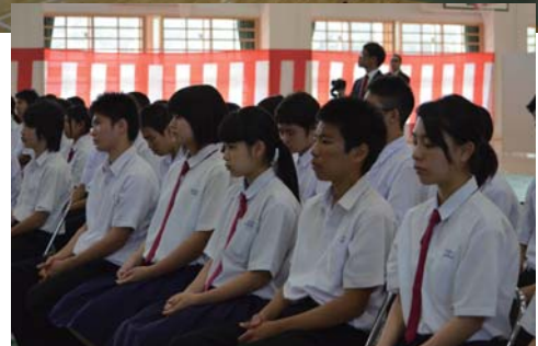
開校式には中学生も参加してくれました