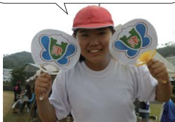
みなさん、うちわの提供ありがとうございます♪

同窓生リレーには 40 組以上が参加。多くの同窓生が最後の運動会に華を添えてくれました。校歌ゆうぎもみんなで踊り、最後は会場の皆さんと校歌と校章の入ったうちわを両手でかざし「津波校大好き」でフィナーレとなりました。