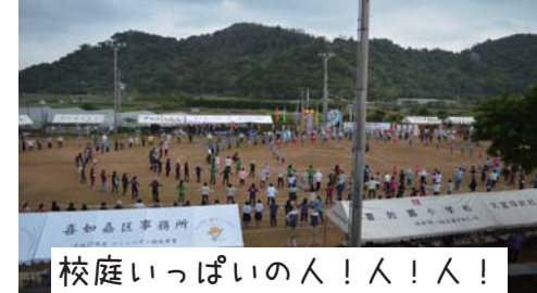
校庭いっぱいの人!人!人!