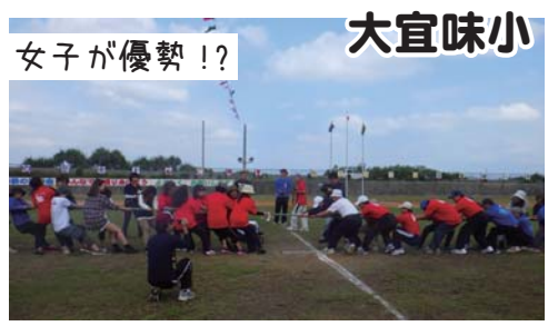
女子が優勢!? 大宜味小