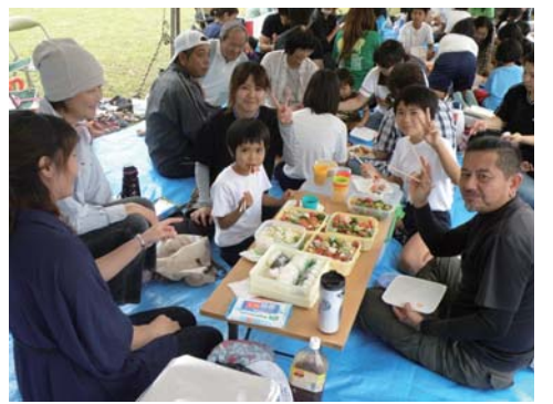
運動会の楽しみと言ったらこれでしょう