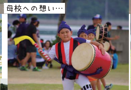
感謝の気持ちを込めて