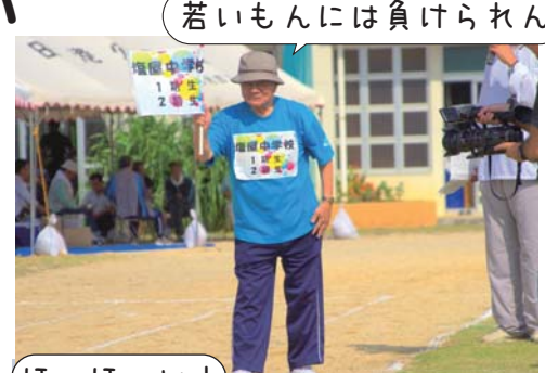
若いもんには負けられん