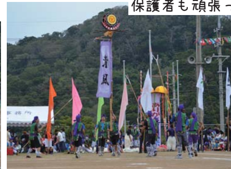
保護者も頑張った!