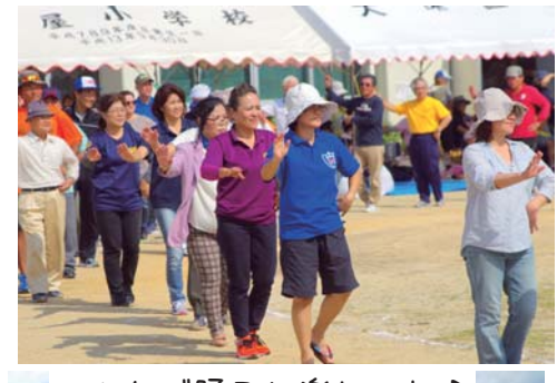
みんなで踊ると楽しいね♪