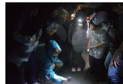
みんなの注目を集めたのは？

今回は鳴く虫観察はカエル観察となり終了しました。ぜひ、来年にはリベンジを行いたいと思います。