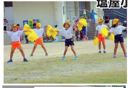
家族のために全力疾走！