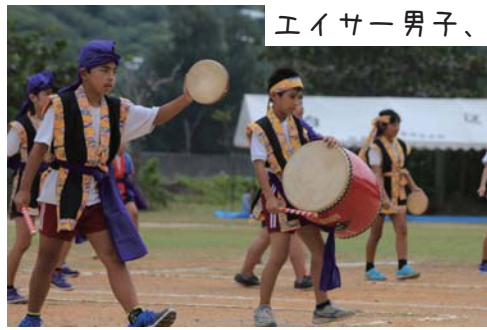
エイサー男子、カッコいい！