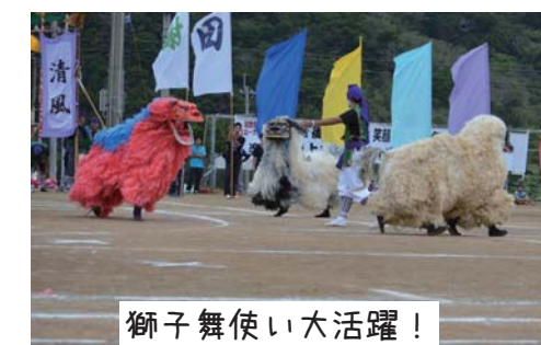
獅子舞使い大活躍!