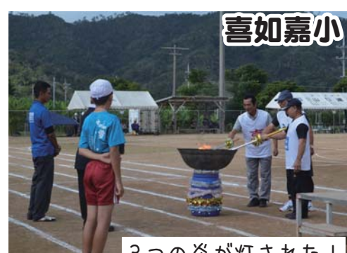
3つの炎が灯された!