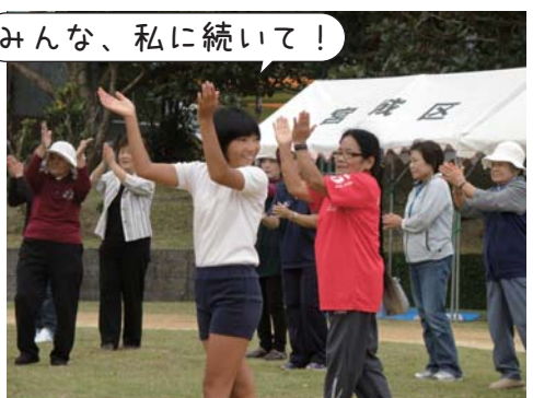
みんな、私に続いて！