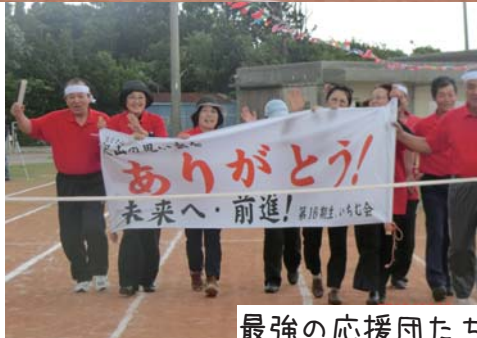
最強の応援団たちが次々降臨!