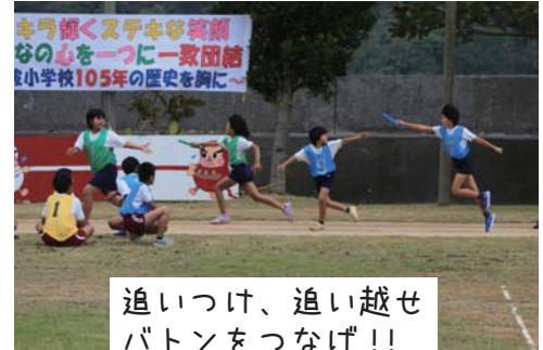
追いつけ、追い越せ バトンをつなげ！！