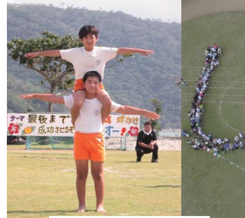
バルーン、膨らむ～ん