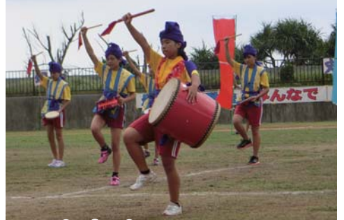
133年分の歴史をのこそう 燃え上がれ 大宜味っ子!