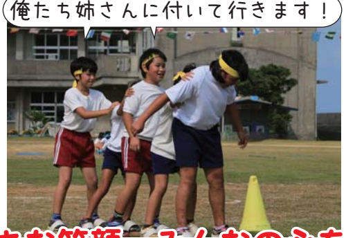
俺たち姉さんに付いて行きます！