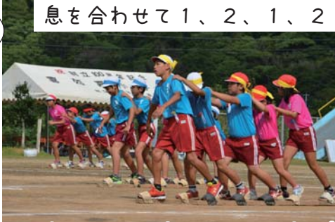
男子vs女子、軍配はどちらに!?