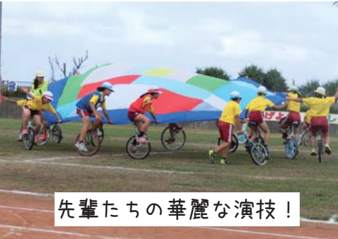
先輩たちの華麗な演技!

133年の歴史ある大宜味小最後の運動会。お揃いの黄色いTシャツを身に着けた33名の児童たちは、一輪車で演技やリレー、低学年の可愛いダンスなど、1年生から6年生まで力を合わせ大宜味らしい運動会にしました。同窓生リレーでは若者から60代以上の方々も参加し、観客が心配になるほどの白熱した競争が続きました。最後はお客さんや同窓生も含め、全員で校歌ダンスを踊り、大盛況のまま幕を閉じました。