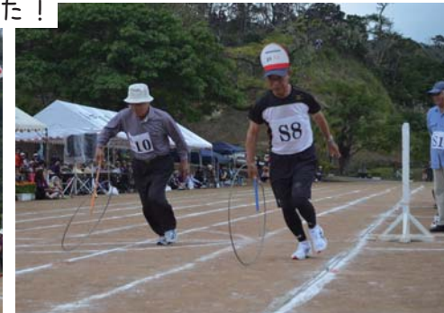
大先輩から若者まで全力疾走