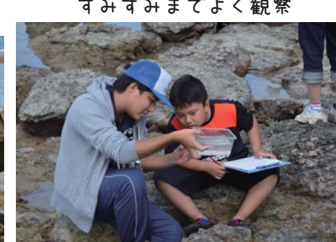
すみずみまでよく観察