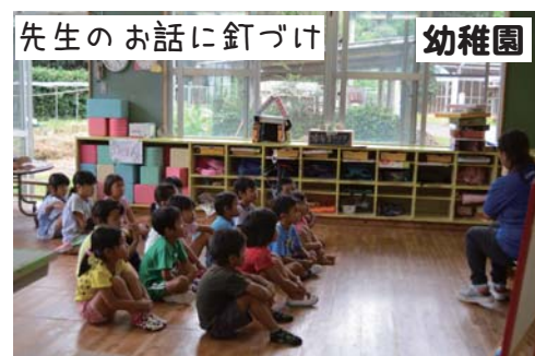
先生のお話につづけ