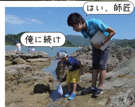
はい、師匠 俺に続け