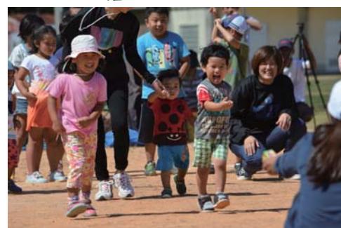
早く幼稚園生になりた～い!!