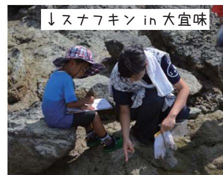
↓スナフキン in 大宜味