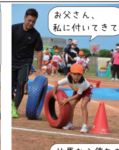
お父さん、私に付いてきて