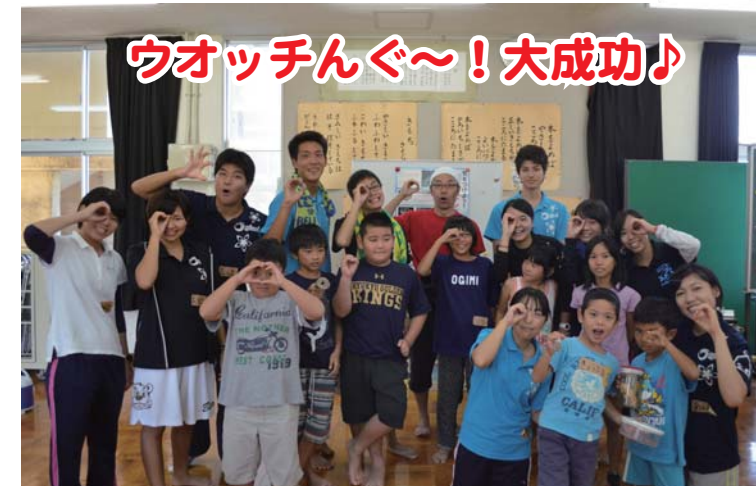
ウォッチング〜! 大成功!

今回の講座では普段何気なく歩いている海岸や岩場に、こんなに多くの生きものたちが暮らしていることを改めて知るいい機会となりました。