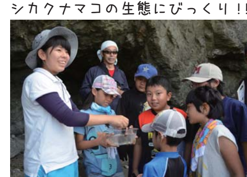
シカクナマコの生態にびっくり!!