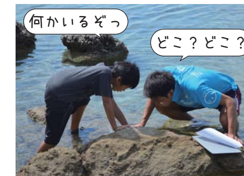
何かいるぞっ どこ?どこ?