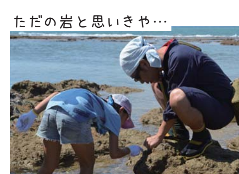
ただの岩と思いきや...