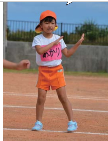
準備体操しっかりやらんとね～