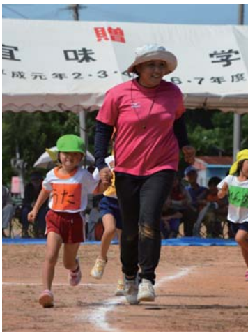
先生と一緒に♪嬉しいな