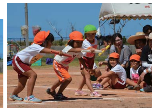
気合い、入ってます!!