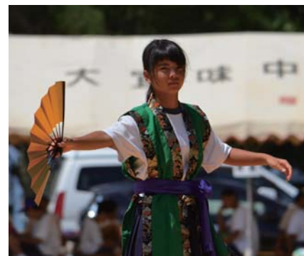
日舞・琉舞、女子たちの華麗な舞