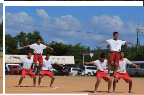
後輩たちも先輩に負けじと頑張りました!!