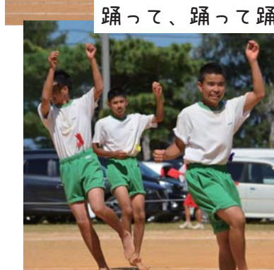
踊って、踊って踊りまくる♪