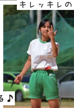
キレッキレのダンスを見せてくれました。