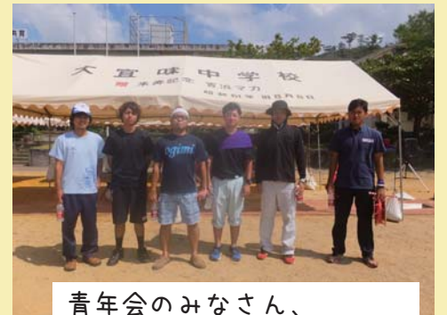
青年会のみなさん、ありがとうございました！！