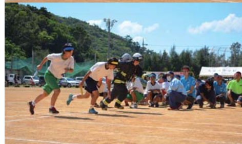
盛り上がった兄弟学級総力走!