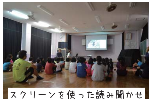
スクリーンを使った読み聞かせ