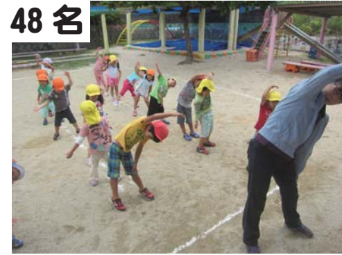
48名 喜如嘉保育所：ミニ運動会