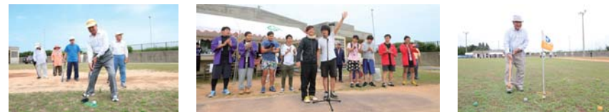
芝目をよんで… るんだはずね

結果は津波区老人会 A が優勝！！ 団体の部では今年も上位3位まで老人会が占め、日頃の練習の成果を見せつけてくれました。