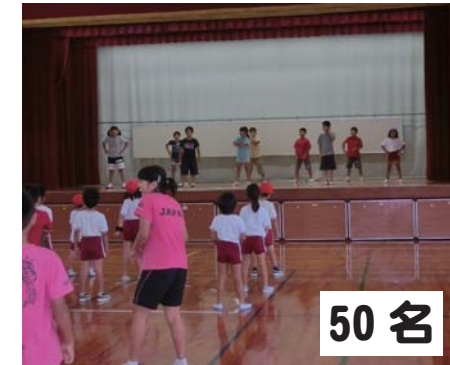
50名 喜如嘉小：妖怪体操・しっぽとり