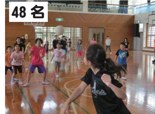
48名 大宜味小：ドッジボール