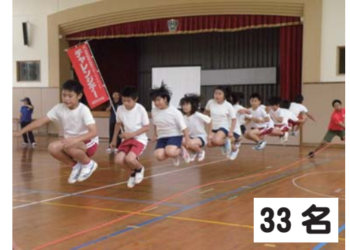
33名 津波小：ダンス・なわとび