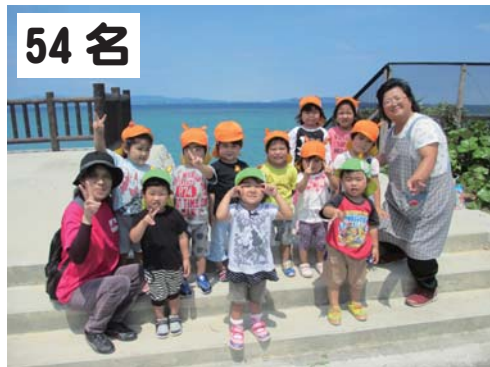
54名 塩屋保育所：結の浜まで歩け歩け