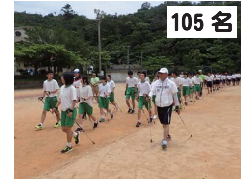
105名 大宜味中：ノルディックウォーキング