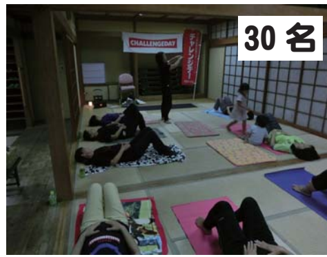
30名 婦人会：ピラティス

昨年は北海道の苫前町と対戦し惨敗に終わったチャレンジデー。 リベンジをかけ、今年は島根県海士町（人口 2342 名、12 回目の出場）と対戦することとなりました。 5月27日（水）、いつもより早い朝の放送、突然のラジオ体操で始まったチャレンジデー当日。 ウォーキングや体操、グラウンドゴルフ、ノルディックウォーキング、ピラティス、バレーボールにな わとび、シャドーピッチングなど様々な種目にチャレンジしてくれました。