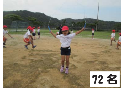
72名 塩屋小：なわとび・バドミントン