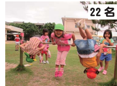
22名 幼稚園：運動遊び