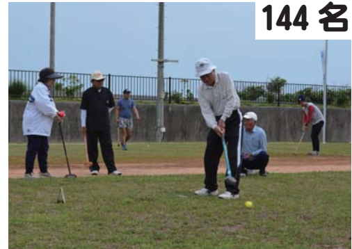
144名 +12名 老人会グラウンドゴルフ大会