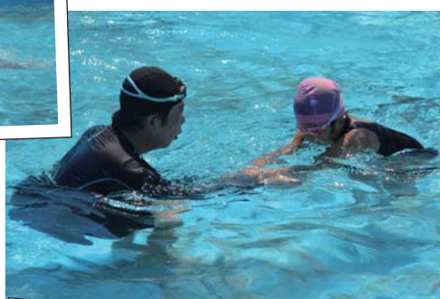
水にも大分慣れました♪