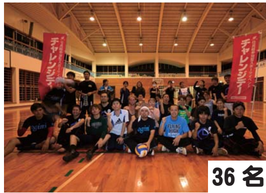
36名 青年会：バレーボール