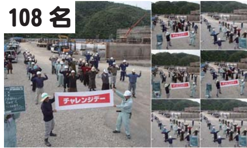
108名 学校建設現場：ラジオ体操・行進