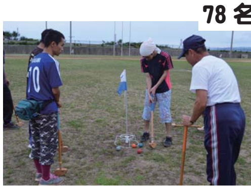
78名 各種団体グラウンドゴルフ大会