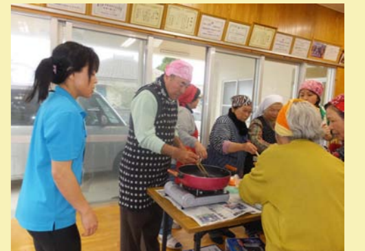
男性も積極的に参加♪