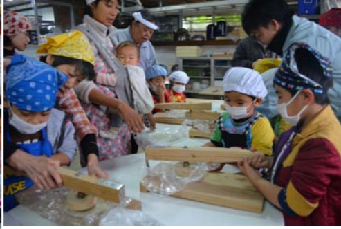
そば粉に水を入れてこねます