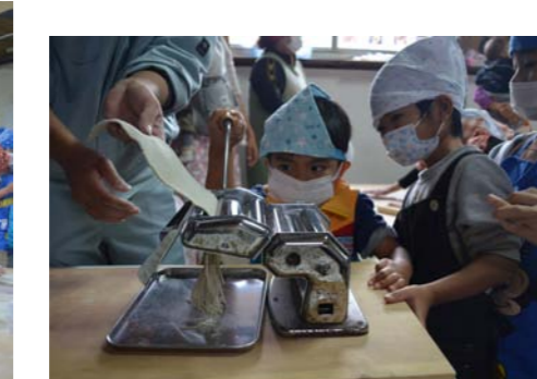
女の子たちも上手♪上手♪