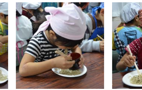
みんな夢中で食べました！！